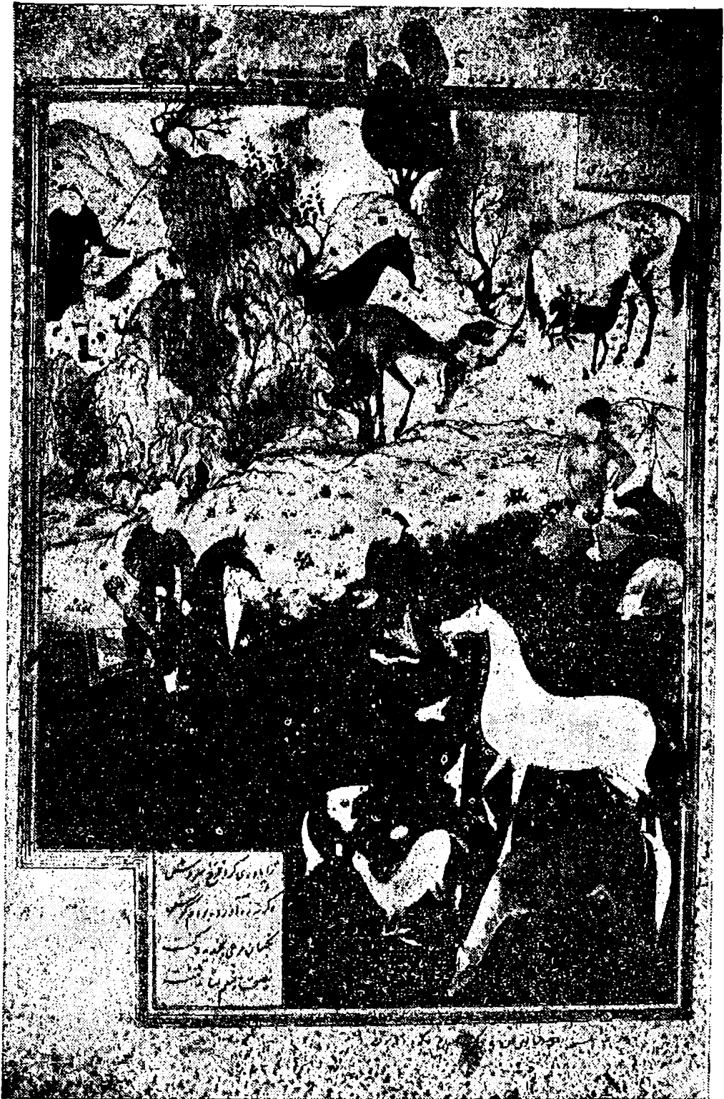
المملك دارا والرعى « صورة أخذت من نسخة خطية بدار السكتب وعليها توقيع المصور البارع — بهزاد »