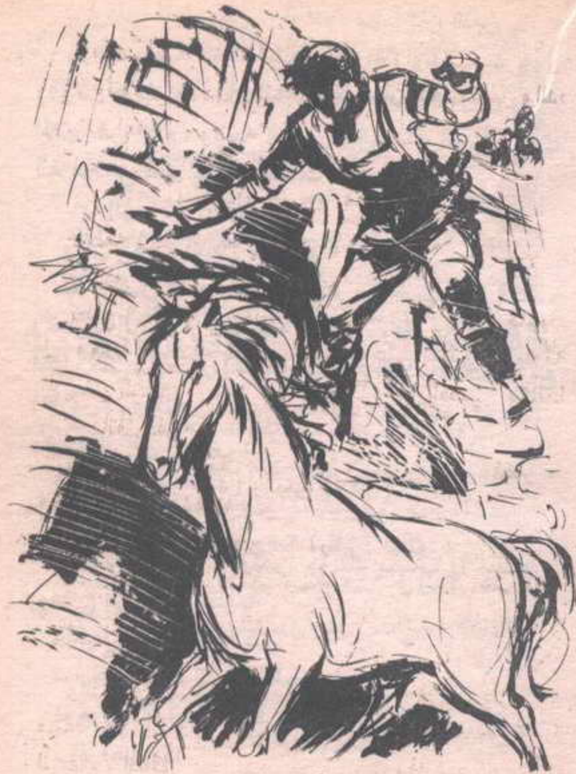
وكان المشهد مدهشاً بحق ..

جسد ( فارس ) يهوى ، و ( رفيق ) يعدو نحوه ..