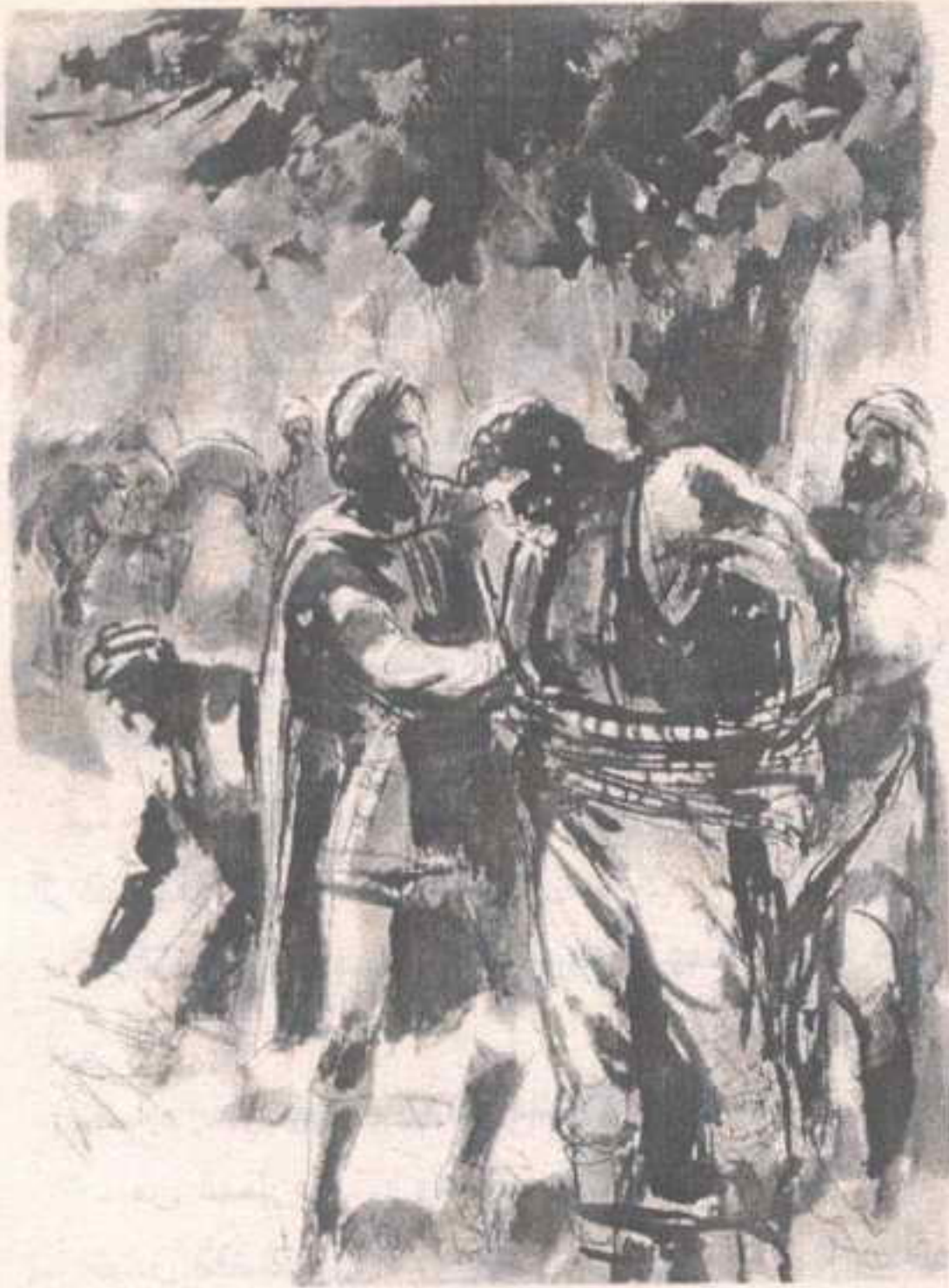
هبطوا عن جيادهم ، وتركوها ترعى فى المنطقة ، وهم يقيدون ( فهد ) المنهك إلى جذع الشجرة الضخم ..

فى عنف ، فألقى ( هيلموت ) نظرة عليه ، قائلاً فى مقت :