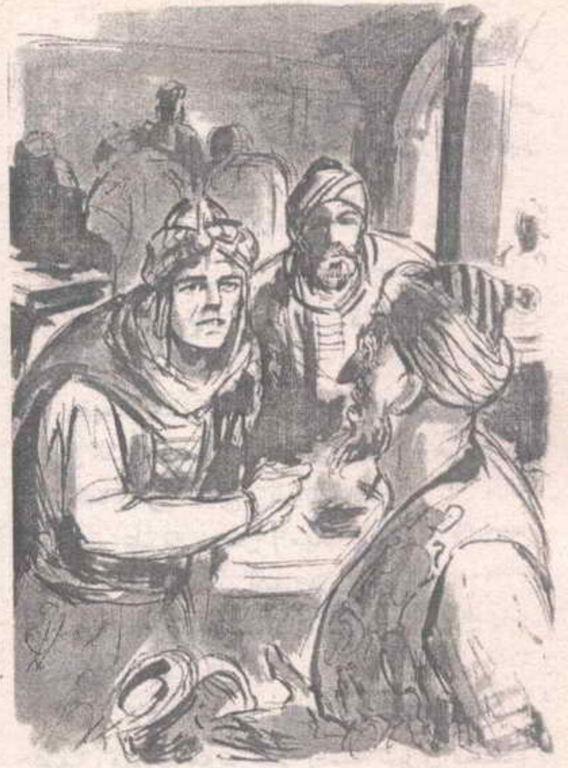
لم يكذ الرجل يسمع الاسم ، حتى انتفض جسده في عنف ، وكأنما هوت على رأسه نيران السماء ..

- ( فهد ) ؟! اتعقد حاجبا ( فارس ) في توتر ، وتبادل نظرة سريعة مع ( مهاب ) ، قبل أن يقول للرجل في صرامة : نعم يا رجل . ( فهد ) . الذي يحضر إلى هنا ، كل حين وأخره لنا الجميع يعرفونه ، ولست أظنك بالذات تجهلني . اتسعت عينا ( حالم ) في هلع ، وهو يتحدث فيهما قبل أن يزدرد شيئا من لعبه في صعوبة ، عبر حلقه الجاف ، قائلا بصوت مرتجف : آه .. ( فهد ) .. إنه لم .. لم يحضر اليوم . كان جوابه ، بالطريقة التي انطقه بها ، ونظرات الأعر والهلح في عينيه ، أشبه بدليل أدائه ، جعل ( مهاب ) يمسكه من قميصه ، ويشده إليه في غضب صارم ، وهو يكرر : أين ( فهد ) يا رجل ؟! لوح ( حالم ) بذراع ، في ارتباغ ، وهو يصرخ :