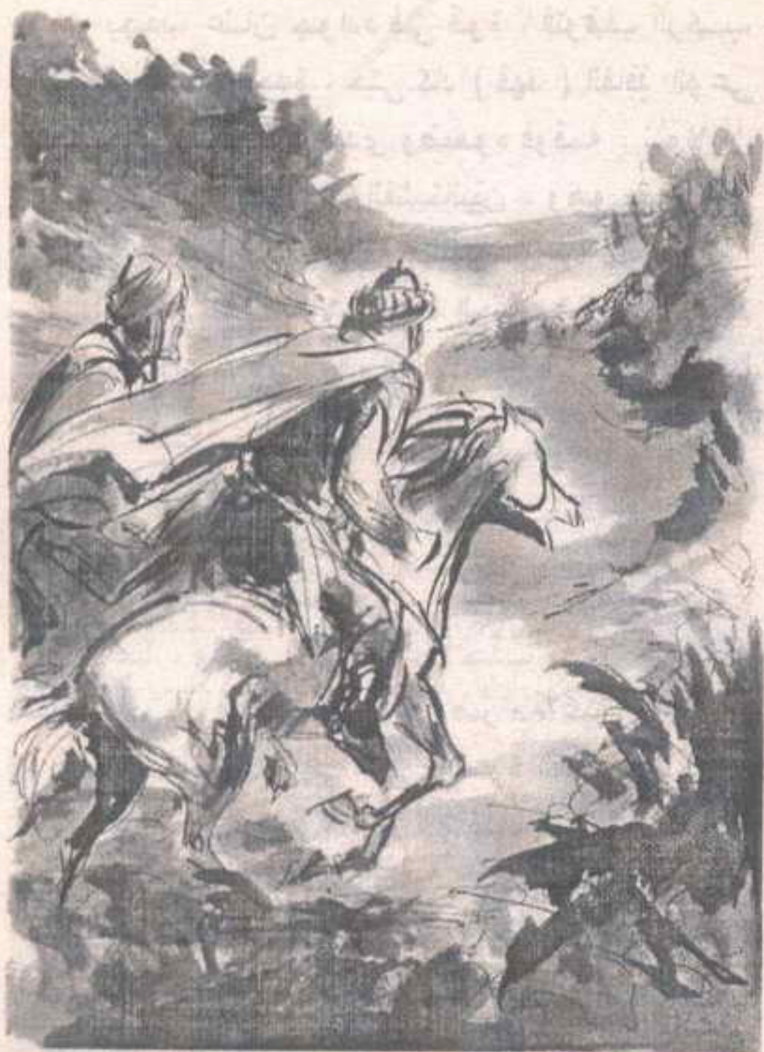
- الشمال الشرقى .. ثلاث ساعات تقريباً . وكان هذا آخر ما تبادلاه من حديث قبل أن يندفع كل منهما ..

انعقد حاجبا ( فارس ) في شدة وهو يقول في حزم :