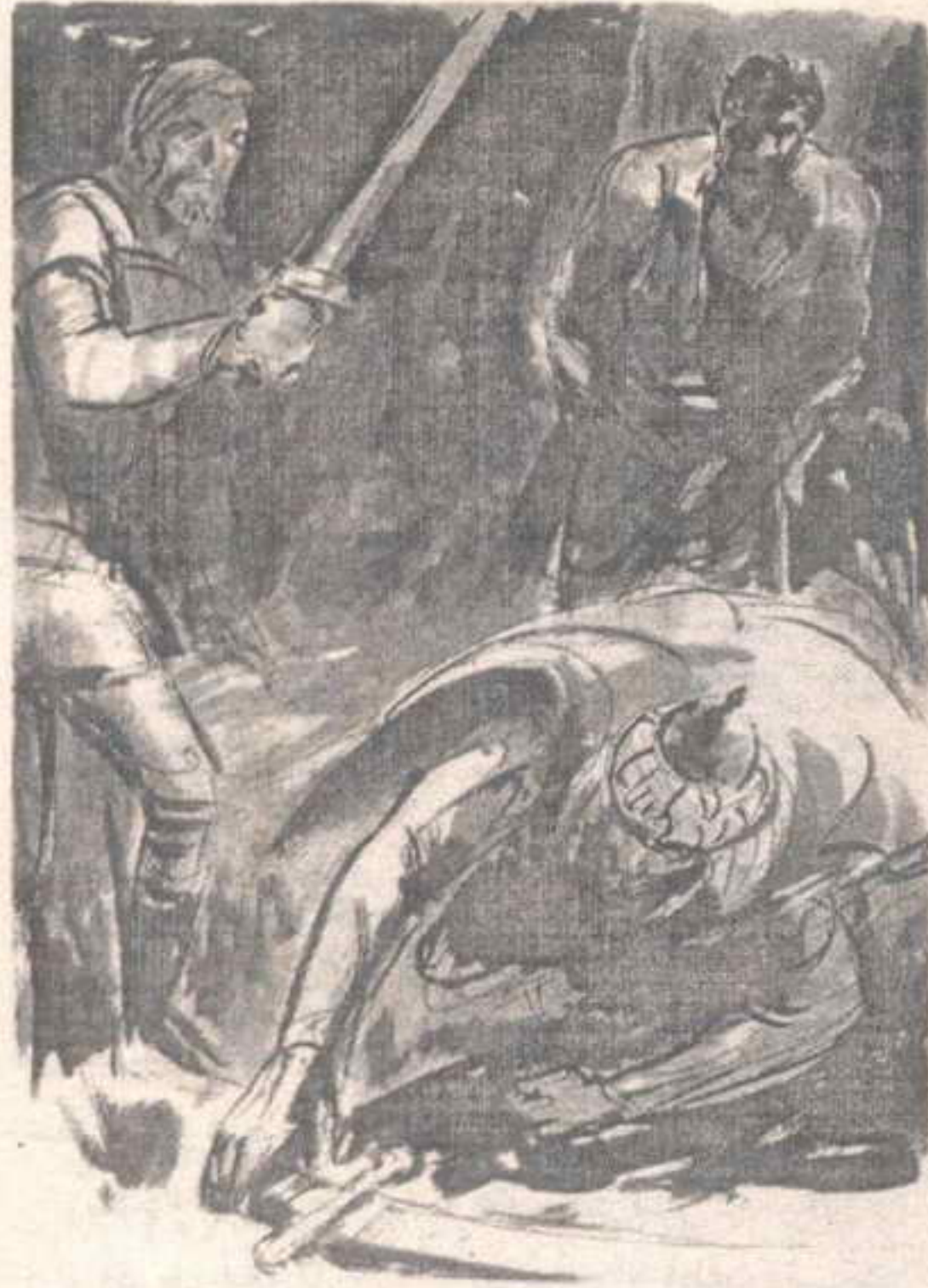
وبسرعة وخفه مبهرتين ، التقط سيفه من الأرض

- لن تنجح أبداً أيها العربي . وعلى الرغم من آلامه ، والسهم الذي ما زال يبرز من كتفه ، وثب ( فارس ) .. وثب وثبة هائلة مذهشة ، ليختطف سيفه الملقى وسط العشب ، صائحاً :