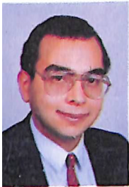
د. أحمد خالد توفيق