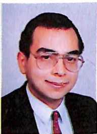
د. أحمد خالد توفيق

اجتمعوا في تلك الليلة يتحدثون عن الرعب .. الرعب الوحشي الأولى الذي لا تدرى له سبباً، كانت لدى كل منهم قصة .. وكان لكل قصة مستمعون ، وهكذا دارت حلقة الرعب ، لكنهم لم يدركوا أن خيوط الفجر الأولى ستسج لهم قصة أكثر هولاً من كل ما حكوه وسمعوه..!