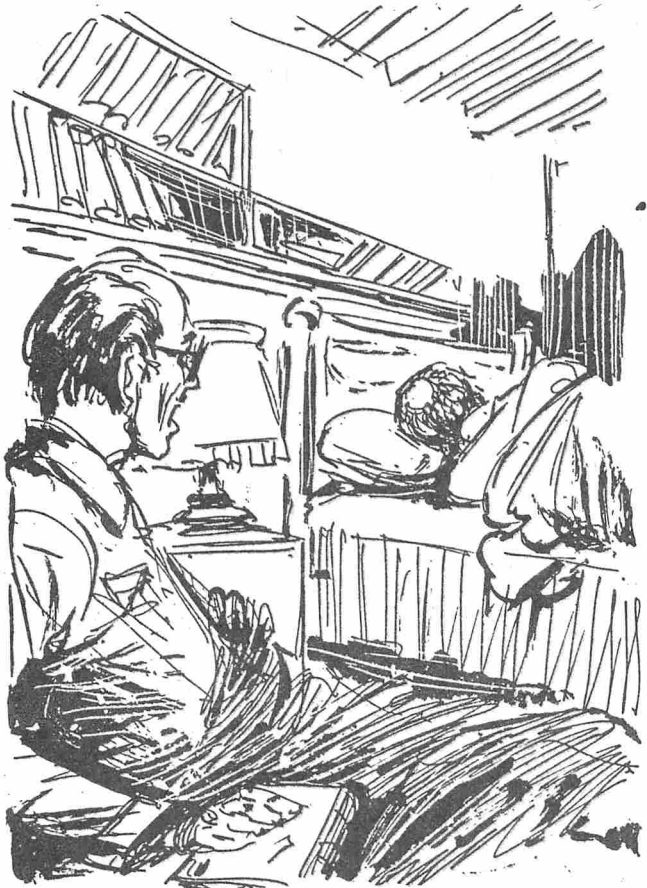
هناك بقعة خالية من الشعر في مؤخرة رأسه .. بقعة مستديرة تماما أرها بوضوح حيث أدار وجهه للحائط بعيداً عني ..