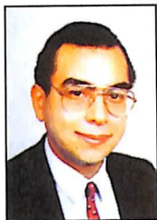
د. أحمد خالد توفيق

روايات تحبب الأنفاس من فرط الغموض والرعب والإثارة