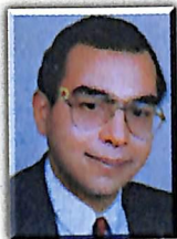
د. أحمد خالد توفيق

اليوم نقدم لكم موضوعاً مسلياً إلى حدّ ما : الكوابيس التي تترك في فراشك أثراً مادياً مؤكداً .. مشعلاً - على سبيل المثال - أو مفتاحاً أو يبدأ مبتورة .. وهذه الظاهرة لاتحدث إلا آخر الليل حين يظل النهار بمنأى عنك .. لكنك تتعلق بالأمل في أن يجيء سريعاً !