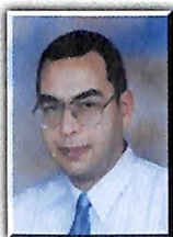
د. أحمد خالد توفيق

تزداد الصواعق سخاءً .. وتهوى اللسنة الملتهبة فوق جهاز منع الصواعق الذى ابتكره (فكتور فرانكنشتاين) ، فتسرى الكهرباء فى دوائر غاية فى التعقيد إلى الجهاز العماق ، والجسد المسجى تحت ملاءته المتسخة .. تتوهج كهرباء قادرة على تحريك الجبال .. تتوهج الغرفة كلها بالنور الساطع ، وتشم رائحة اللحم المحترق ، وتسمع الأنين .. الأنين العميق من تحت الملاءة !