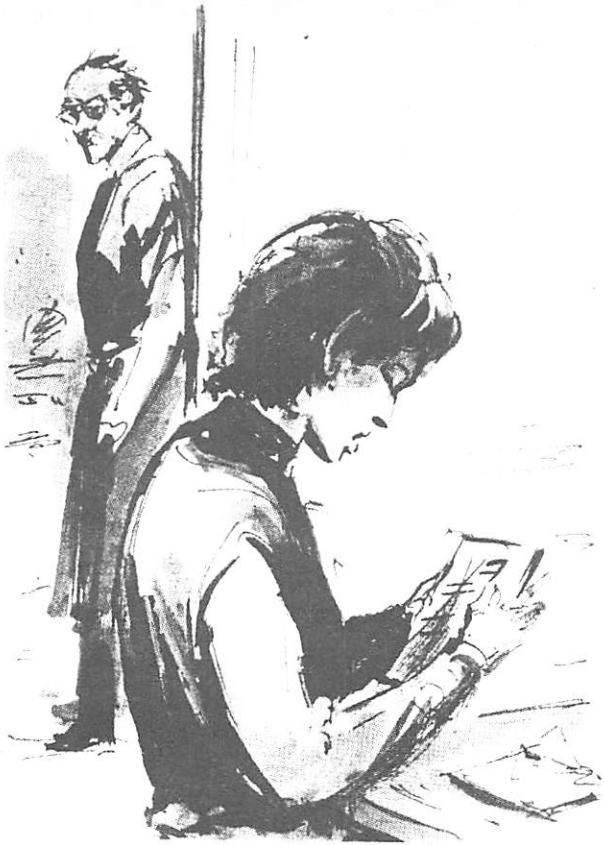
خطاب وجدته (سارة) على مكتبها