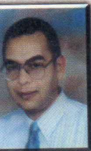
د. أحمد خالد توفيق