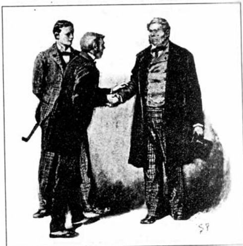
Sydney Paget 1891

فسمعنا أننا محبطاً صادراً من أسفل، وبدأ الناس يتحركون في كل اتجاه مبتعدين حتى لم نرَ أحداً