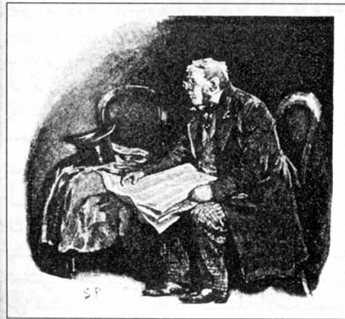
Sydney Paget 1891

نفخ عميلنا الجليل صدره مُظهرًا بعض الكبرياء وسحب جريدة متسخة مجعّدة من الجيب الداخلي لمعطفه الثقيل، وبينما هو ينظر إلى عمود الإعلانات والصحيفة مبسوطة على ركبته أخذت أنفخه، وسعيت - مستخدماً طريقة رفيقي - إلى قراءة الإشارات التي قد تظهر من مظهره أو ملبسه.