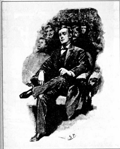
Sydney Paget 1891

هولمز المزدوجة نفسها بالتناوب، فدقته المتناهية وذكاؤه يمثّلان - كما اعتقدت دائماً - ردّ فعل مضاداً لمزاجه الشاعرى ونزعه التأملية اللذين يسيطران عليه من حين إلى آخر، حيث ينقله هذا التقلب في طبيعته من حالة الكسل الشديد إلى حالة من النشاط المستبد.