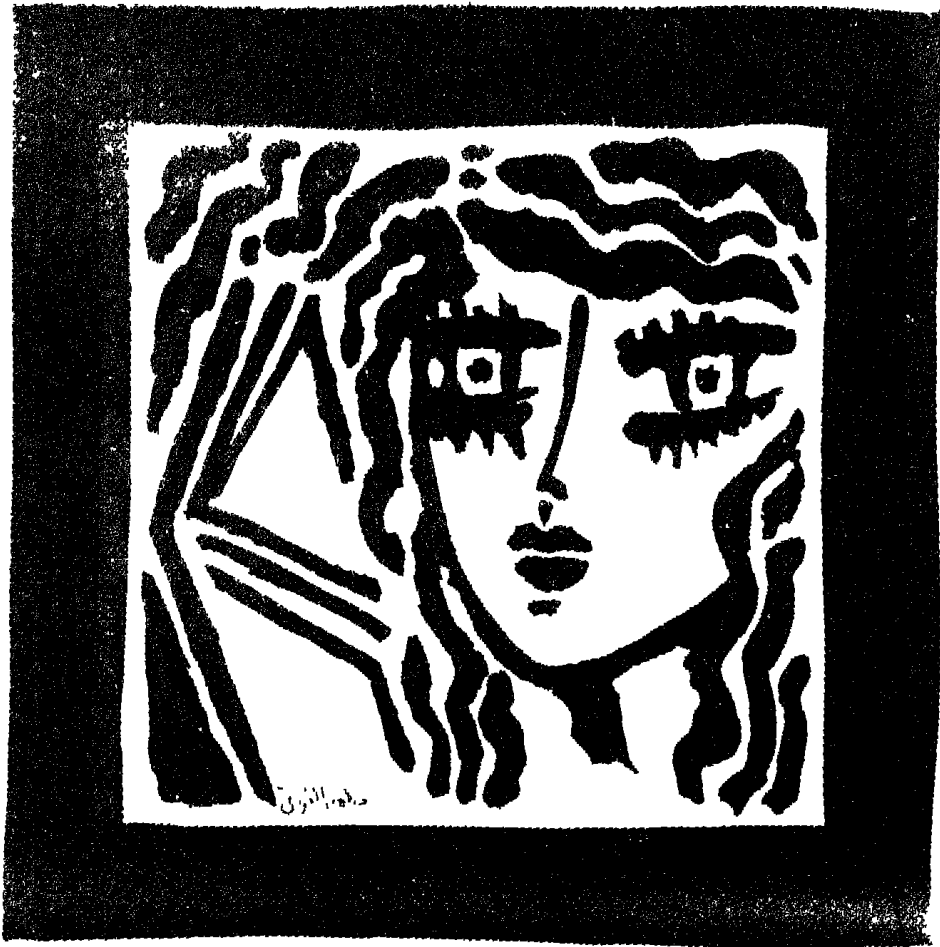
العتب على النظر