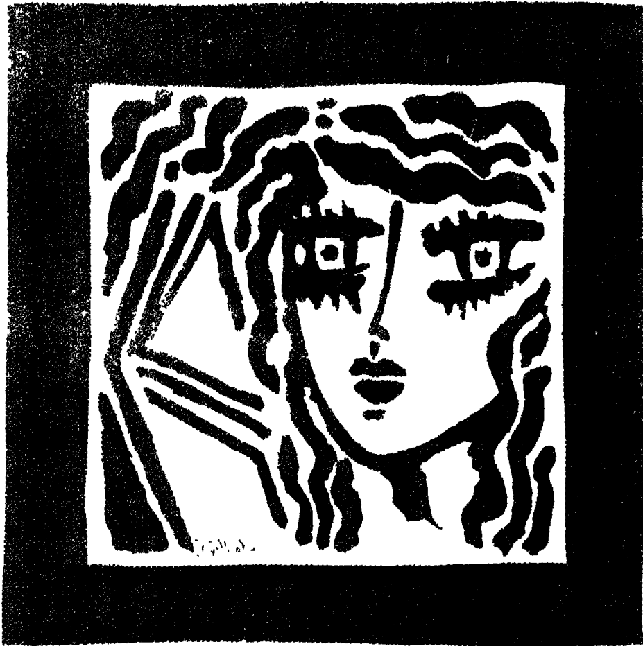
بيت من لحم