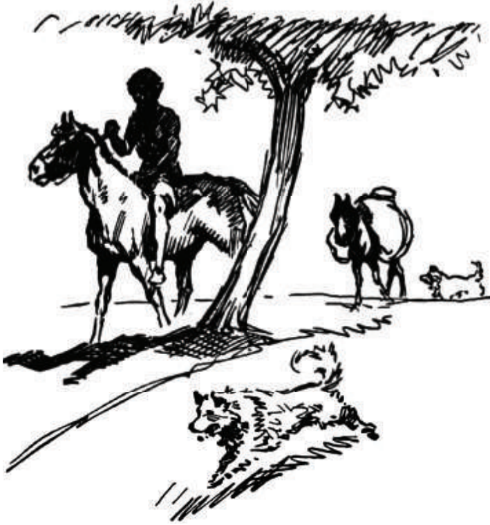
«مع حصاني وكلبي ومهري، انطلقت.»

بشري. نبحت الكلاب وأجاب كلباي. لم أكن أعرف شيئاً سوى أنني الإنسان الحي الوحيد في العالم بأكمله. لم أكن أتصور أن أجد بشراً آخرين؛ دُخان وبكاء رضيع! على البحيرة، هناك أمام عيني على بُعد يقلُّ عن مائة ياردة، رأيت رجلاً، رجلاً ضخماً الجثة. كان واقفاً على الحَجَر البارز يصطاد السمك. كنتُ في غاية التأثر. أوقفتُ حصاني، وحاولت أن أنادي على الرجل لكنني لم أستطع. لوحتُ بيدي، وبدا لي أن الرجل قد نظر إليّ، لكنه لم يلوّح. بعد ذلك، أسندتُ رأسي على ذراعيّ هناك على السرج. كنتُ خائفاً من النظر مرةً أخرى؛ إذ كنتُ أعلم أنها هلوسة، وكنتُ أعلم أنني إذا نظرتُ ثانية فسوف يختفي