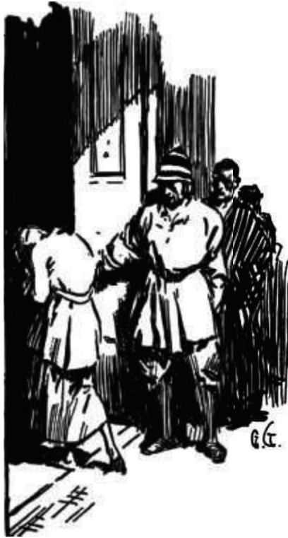
«دفعناها إلى خارج المبنى.»

بعد ذلك، بدأ الرُعب. تركنا الموتى على حالهم، وأرغمنا الأحياء على عزل أنفسهم في حجرةٍ أخرى. بدأ الطاعون ينتشر بين البقية منّا، وفور ظهور الأعراض، كنا نُرسل المصابين إلى العُرف المعزولة. أرغمناهم على المسير إلى هناك بأنفسهم كي نتفادى وضع أيدينا عليهم. لقد كان ذلك أمرًا مفاجئًا، وبالرغم من ذلك، ظلّ الطاعون يتفشّى بيننا، وامتلاتِ الغرفة بعد الأخرى بالموتى والمُحتَضرين. ولهذا، فقد تراجَعنا نحن الأصحّاء إلى الطابق التالي والذي يليه قبل أن يكتسح هذا العدد الضخم من الموتى المبنى بأكمله، غرفةً غرفةً وطابقًا طابقًا.