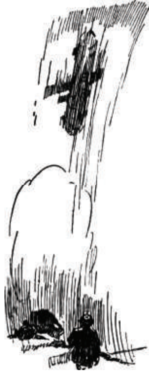
«سقطت السفينة عمودية على الأرض.»

مرَّ يومٌ آخرٍ وعندما وصلنا إلى نايلز، كنَّا ثلاثة. وبعد نايلز، في منتصف الطريق السريع، وجدنا واذوب. تعطلت السيارة، وهناك على البُسْط التي فرشوها، رقدت جثة أخته وجثة أمه وجثته هو أيضًا.