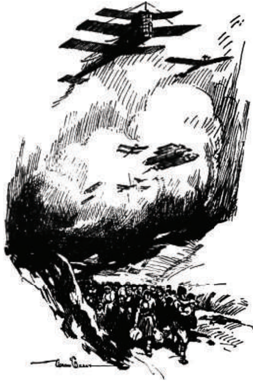
«كانوا ينزحون من المدينة بالملايين.»

سوى أن نستنتج أنّ ما حدث في أمريكا، قد حدث في أوروبا، وأنّ السيناريو الأفضل، هو أنّه لم ينجُ على تلك القارّة بأكملها سوى بضع عشراتٍ من البشر. وعلى مدى يومٍ آخر ظلت الأخبار تردُّ من نيويورك، ثم توقّفت هي أيضًا؛ فإما أنّ الرجل الذي كان يبيّتها وهو جالسٌ في مَبْنَاهِ العالِي قد مات بسبب الطاعون، أو أنّ الحرائق العظيمة التي ذكر أنها كانت تندلع من حوله، قد التهمتّه. وما حدث في نيويورك، حدث أيضًا في جميع المدن الأخرى. فلم يختلف الوضع في سان فرانسيسكو وأوكلاند وبيركلي.