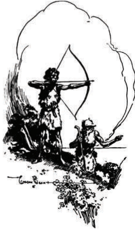
شدَّ الصبي وتر القوس بتمهل.

حدَّق العجوز في الخطر المائل أمامهما من تحت ورقته الخضراء، ووقف هادئاً مثلما فعل الصبي. استمرَّ هذا التفحص المتبادل لبضع ثوان، ثم كشف الدبُّ عن اهتياجه المتزايد؛ فأوماً الصبيُّ إلى العجوز بحركةٍ من رأسه بأنَّ عليه أن يتنحَّى جانباً عن الطريق، وأن ينزل عن الجدار. تبعه الصبيُّ وهو يسير بظهره إلى الوراء، بينما لا يزال يُمسك بوتر القوس جاعلاً إيَّاه مشدوداً وجاهراً. انتظرا إلى أن سمعا صوت تهشُّمٍ قادم من بين الأجمات على الجانب المقابل من الجدار أخبرهما بأنَّ الدبَّ قد واصل مسيره. ابتسم الصبي ابتسامَةً عريضة وهو يسير عائداً إلى الطريق ومن ورائه العجوز.