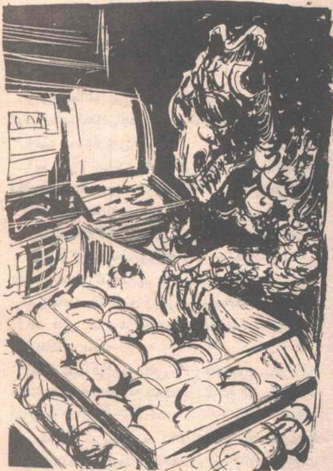
انطلق فحيح الوحش يتردد في حجرة الدفن الملكية ، في قلب

تهللت أسارير ( سلوى ) ، وهي تهتف في سعادة :