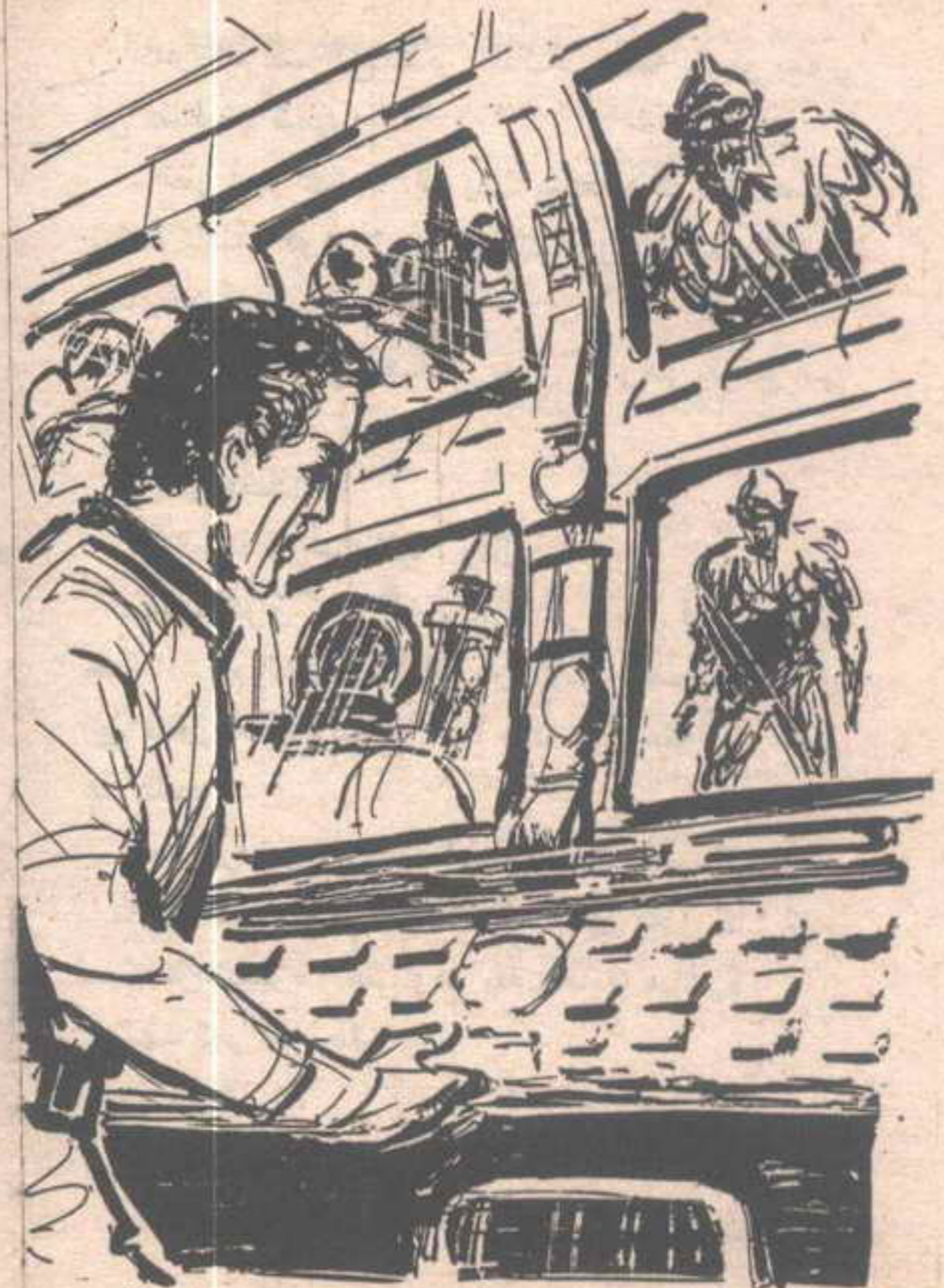
انعقد حاجبا ( رمزي ) في شدة ، مع هذه المعلومة الجديدة ..