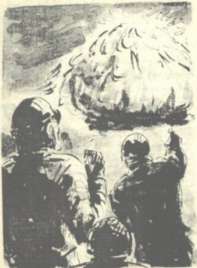
استدار الجميع إلى حيث يشير ، وقفزت دهشتهم إلى ذروتها ..

رفع أحدهم رأسه إلى أعلى ، مغمضاً في توتر : - ومن أدرانا أنه لا توجد حراسات احتياطية أخرى !!