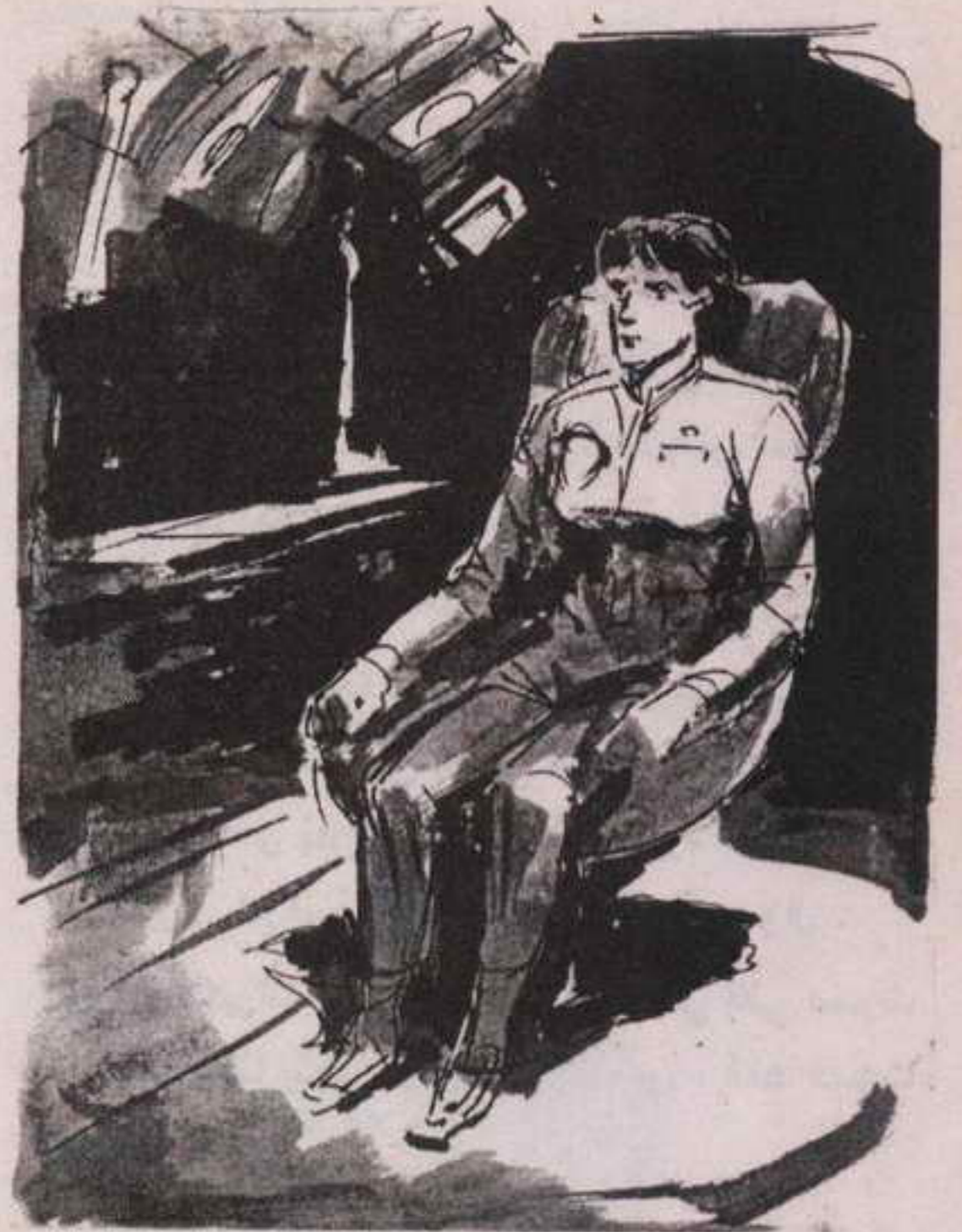
وعبر مكبرات صوتية خاصة ، تضيف على صوت المتحدث رنيناً يبعث الرهبة في النفوس ، أتاها صوت صارم ؟