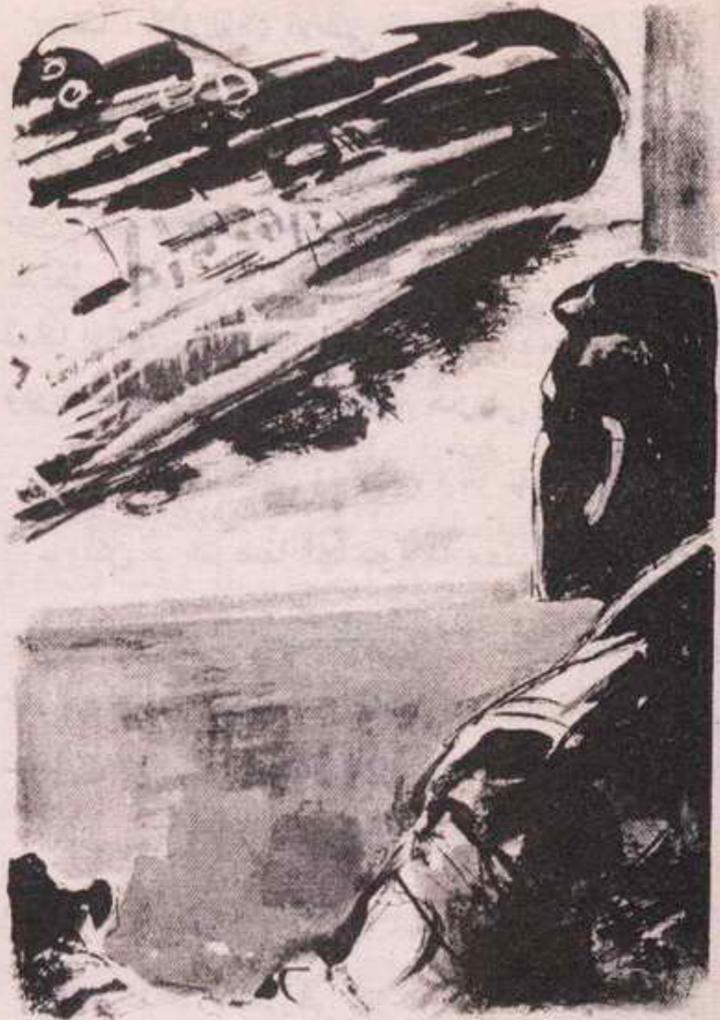
عرضت الشاشة صورة حادة الألوان ، بين الأخضر والأحمر والأزرق ، ترسم حدود الغواصة ( ب : ن - ١٠٣ ) ، الرابضة في الأعماق ..