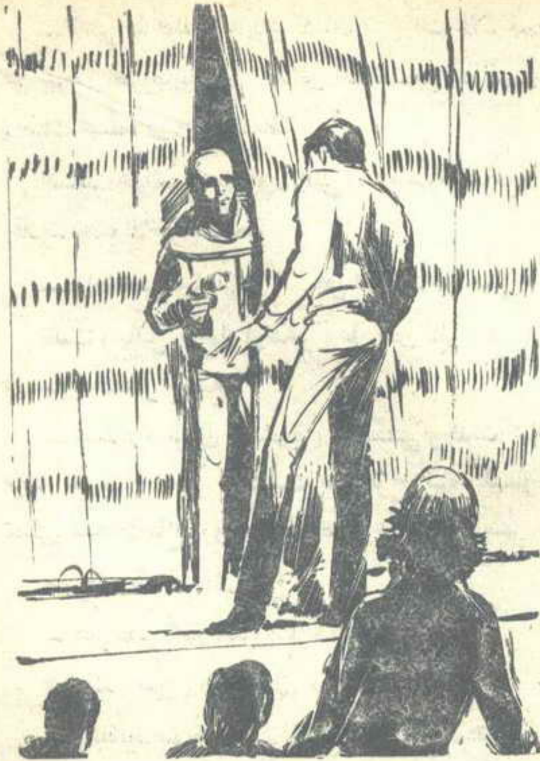
استدار ( نور ) في هدوء موليا ظهره لرفاقه ، ومواجهها الرجل الذي برز من وراء الستار ..

أشاح ( نور ) بذراعه ، قائلا في ابتسامة غامضة :