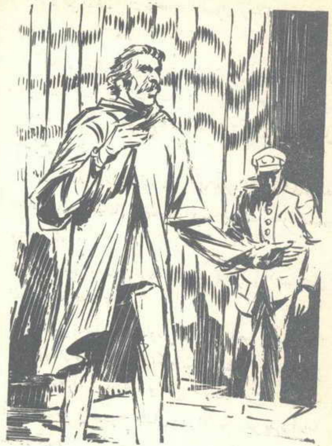
تردد الرجل لحظة ، ولكنه شعر بأنظار الجميع تركز عليه ، فتحرك في تردد واعتلى خشبة المسرح ..

ارتفع جسد الرجل المغطى ببطء إلى أعلى ، وبدأ يتمايل مع حركة العصا الرفيعة التي يمسك بها الساحر ، وكأنما انعدم وزنه ، فهمس ( نور ) في أذن ( رمزي ) : — يمكنني أن أفعل ما هو أفضل في غرفة تدريب رواد الفضاء .