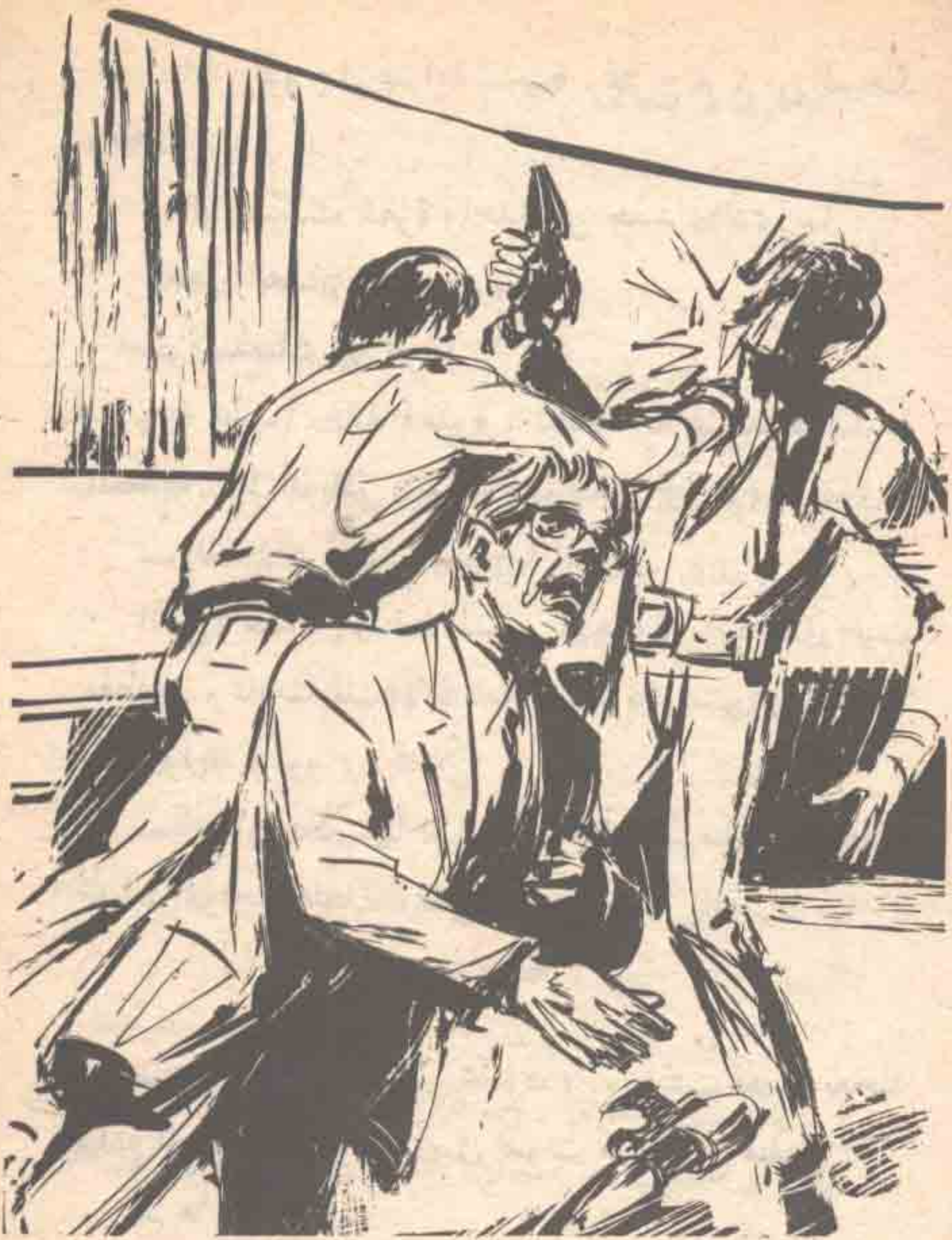
وحاول ( هشام ) أن يدير مسدسه نحو ( نور ) ، ولكن هذا الأخير قفز جانباً ، وأمسك معصم خصمه