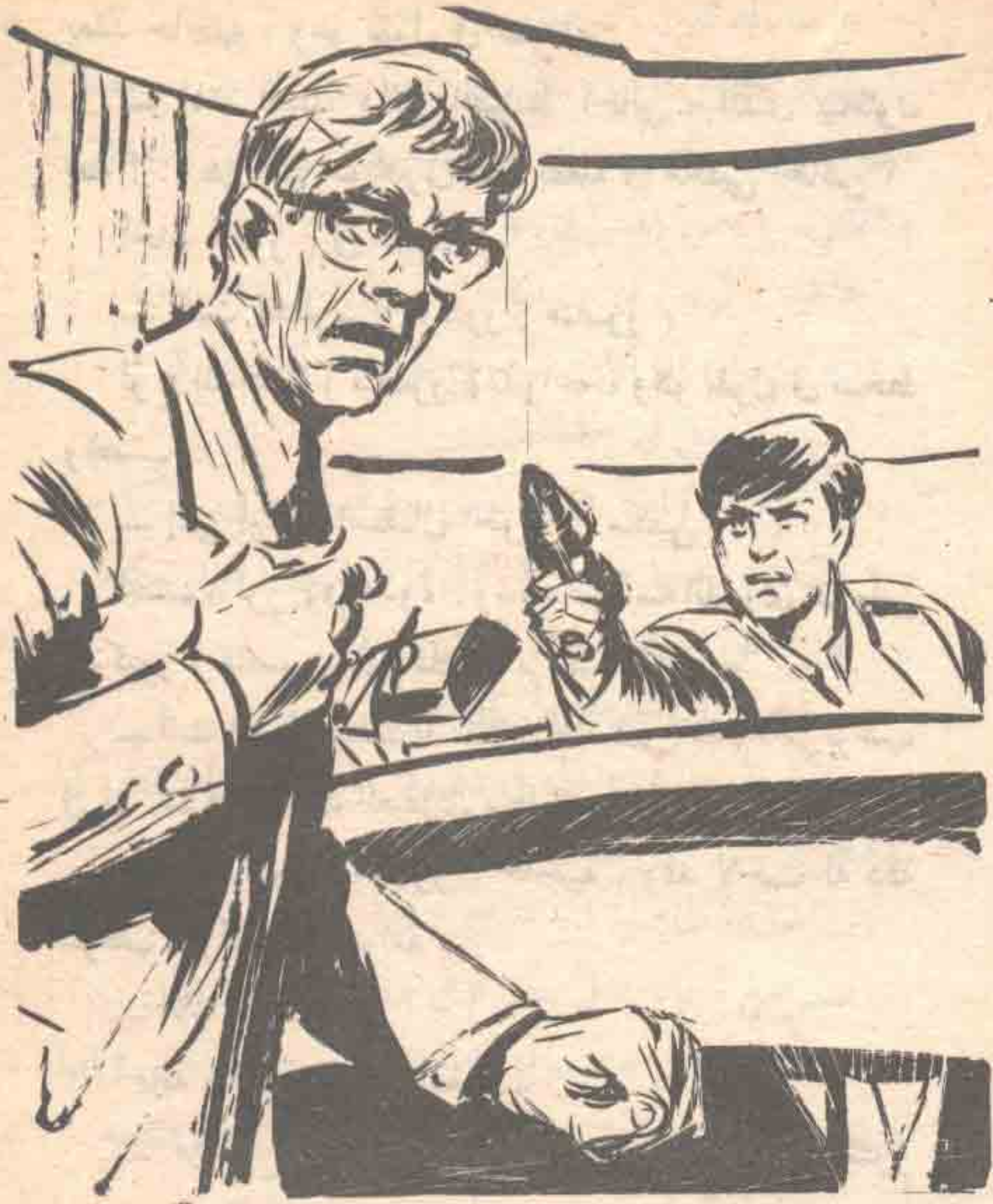
ثم التفت ليجد (نور) جالسًا خلف مكتبه، ومصوبًا إليه مسدسًا ليزريًا

أحد ، ولن يتخذ صورته الصحيحة في ذهني ، إلا بعد أن ألتقي بالدكتور ( منصور ) ، وأكشف حقيقة تجاربه السرية .