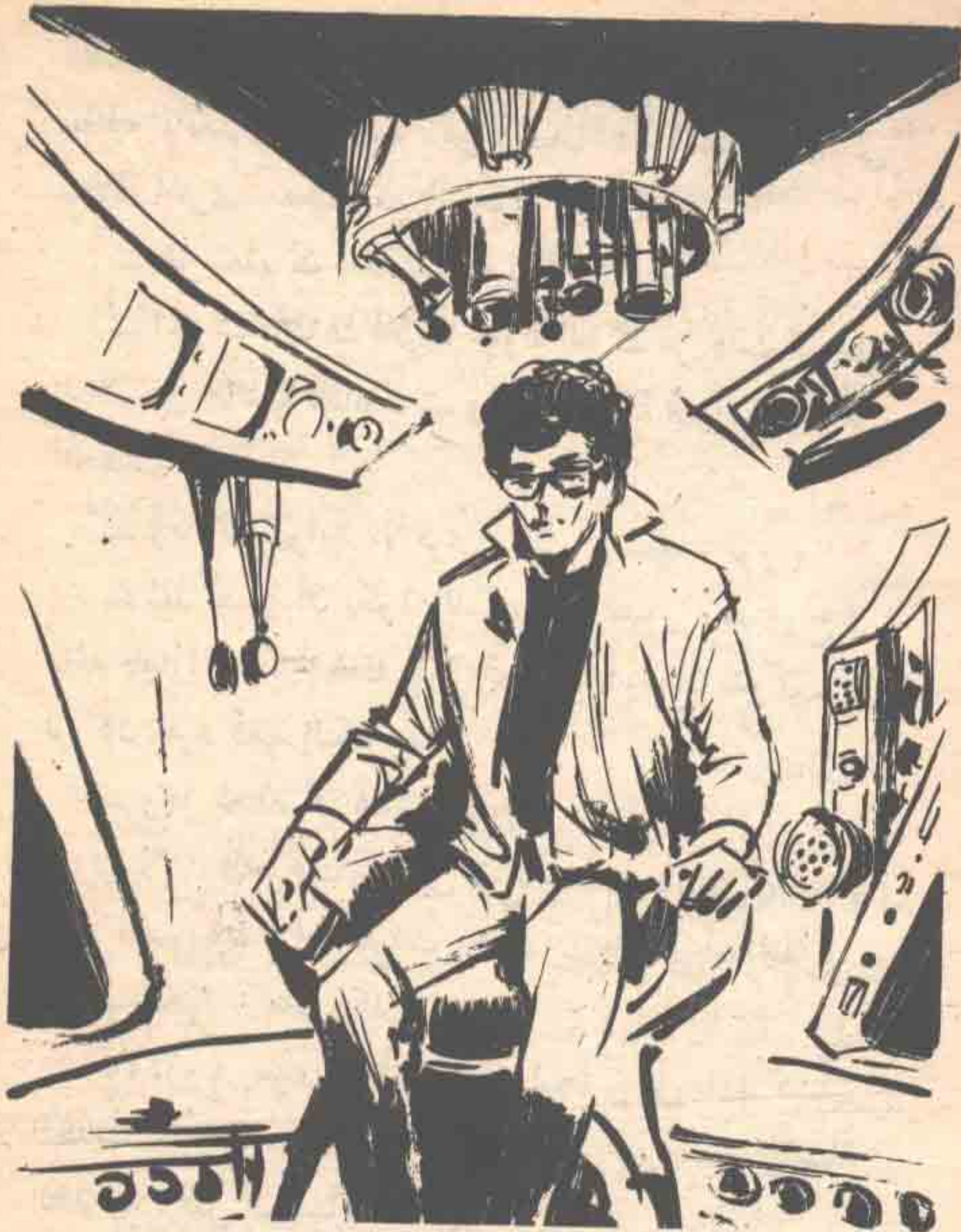
وَأَتَّخِذُ مَكَانَهُ فَوْقَ مَقْعَدِ كَشْفِ الْكُذْبِ ، حَيْثُ ارْتَفَعَ صَوْتُ الْمُحَقِّقِ يَسْأَلُهُ ، بَعْدَ أَنْ تَحَقَّقَ مِنْ اسْمِهِ وَمِهْنَتِهِ

للقتل ، نظرًا لوصول الدكتور ( منصور ) بعد لحظات من الحادث ، واختفاء الفتاة ، ولقد قام بعملية بحث بارعة ، أثبت خلالها أن الفتاة لم تكن سوى صورة هولوغرافية مجسّمة ، تمّ بثها عبر خلية ليزرية خاصة ، وأعتقد أنه قد شكّ في أن تكون للدكتور ( منصور ) علاقة بما حدث بعد ذلك ، من اتهام ( نور ) بالخيانة ، فذهب إليه ، وهناك اختفى .