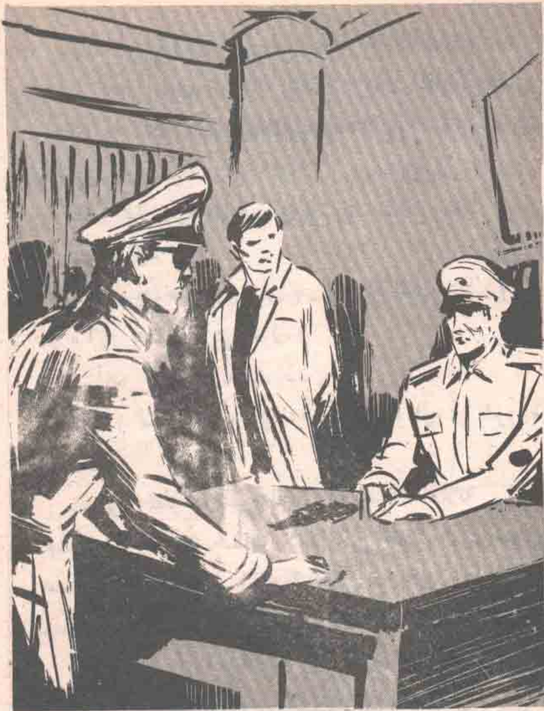
تطلع ( رمزي ) إلى عيني قائد ( الجستابو ) مباشرة ، ولخيل للرجل ، الذي امتلأ التاريخ بالروايات الخيفة عنه ، أن عيني ( رمزي ) تشعان ببريق عجيب ..

— ولكن الحارسين سيمطرانك بالرصاص ، لو لجأت إلى أية خدعة .