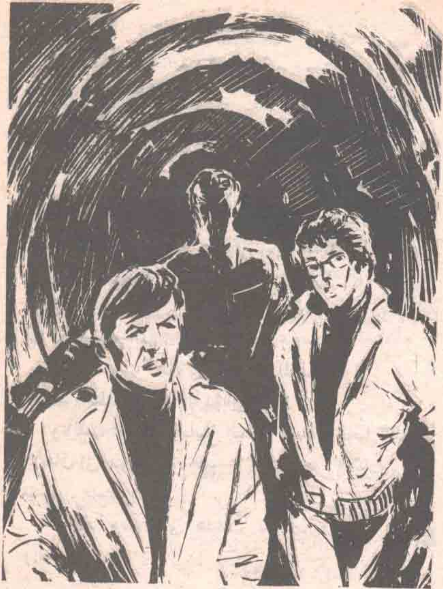
غمغم ( محمود ) في توثر ، وهو يسير إلى جوار ( نور ) و ( رمزي ) ، في أنفاق ( باريس ) المظلمة

شرد ( خالد ) ببصره لحظات ، ثم قال في صرامة : — لا داعي للانتظار بعد الآن ، سنقفز بـ ( ألمانيا ) العظمى في طفرة تكنولوجية ، إلى عصر الليزر ، والقنبلة الذرية .. سنهزم الحلفاء كلهم دفعة واحدة .