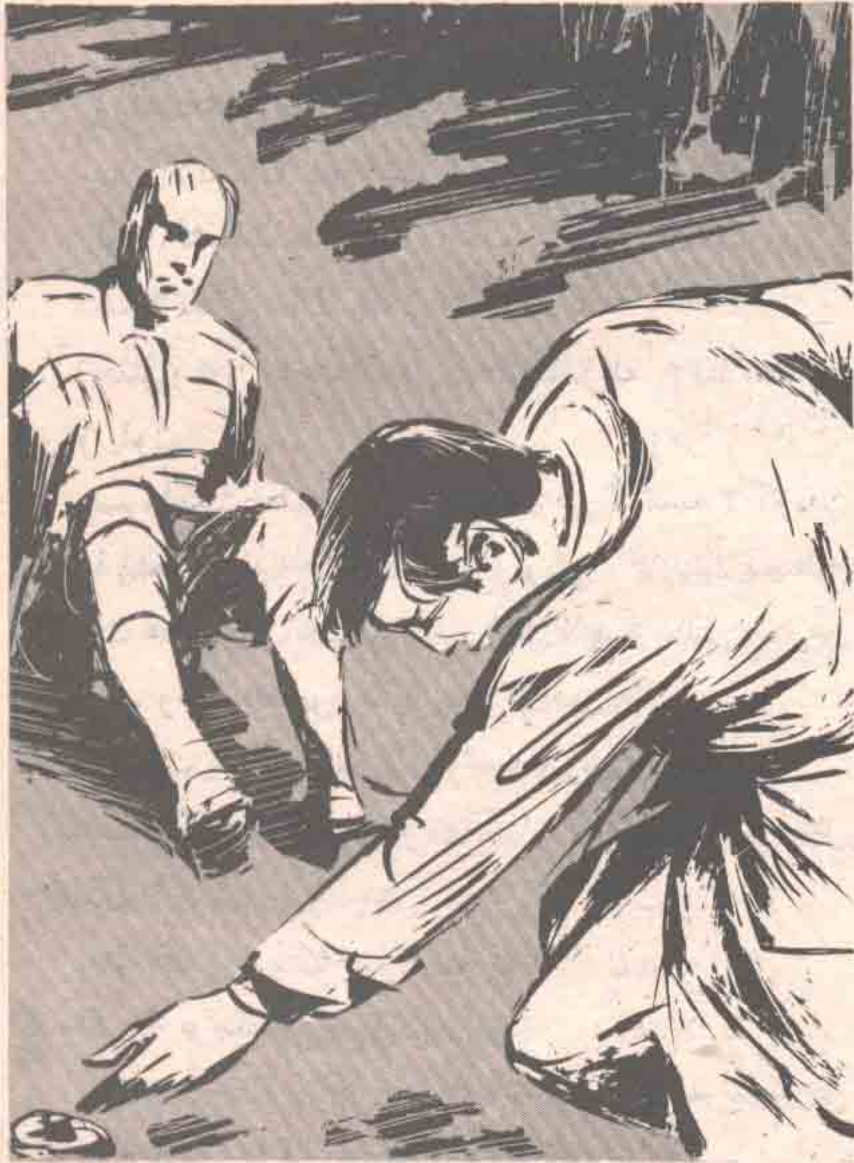
واتسعت عيناه في ذعر ، حينما رأى ( نور ) يلتقط القرص في سرعة ، فصاح في مرارة : — مستحيل !.. مستحيل !