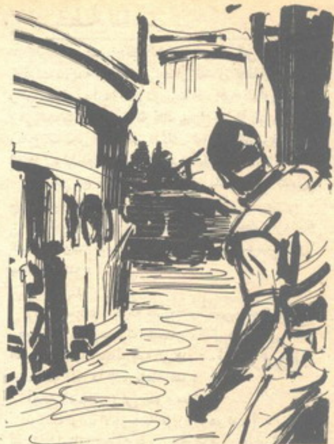
والصق بمجدار المنزل المقابل لحظة ، راقب خلالها واحدة من دوريات المراقبة الجلوريالية ، وهى تجوب المنطقة ..

قفز ( ديجنتى ) فى مقعده ، ليتفادى الانقضاضة ، ولكن