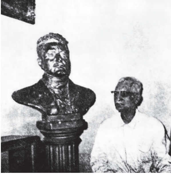
العقاد يستمع إلى المذيع في حجرة الصالون.

إنني لا أسأل عن أولئك القراء والدارسين الذين ألفوا عشرات الكتب بالليل والنهار، إن هؤلاء ينظرون إلى كتبهم كما ينظر الجوهري إلى الثروات المخزونة عنده في صناديق البلور من نوادر الفصوص والأحجار الكريمة، أو كما ينظر البستاني إلى أحواض الزهر، وهي تتزعزع أو تذبل بين يديه، أو كما ينظر صاحب القصر إلى أسراب الحسان المقصورات فيه، أو كما ينظر المهندس إلى الأضرار التي في لوحته وقد ينطلق كل زر منها بما يحرك مدينة بأسرها، وكلهم يملكون زمامهم، أو زمام تلك المرثيات وهم يحسون بها، وكلهم يحضرون منها ما ألفوه وتعودوه وكرروه، وقد يغيب عنهم منها جانب المفاجأة والغرابة، ولكنني أحب من حين إلى حين أن أستغرب ما ألف وأن ألف ما أستغرب، ويثير هذا الشوق في خاطري أن أشهد وقع هذه الغرابة مرتجلاً في بعض النفوس، ولا سيما النفوس التي تقارب الكتب من بعيد.