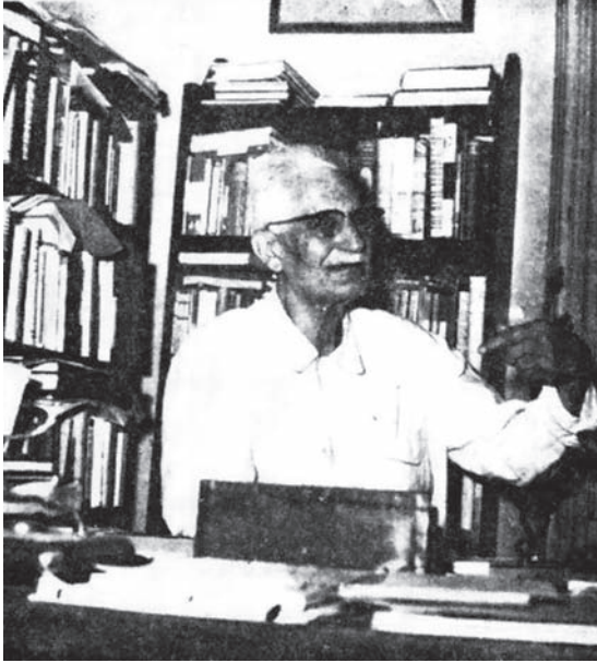
في حجرة المكتبة.

قال صاحبي: هذا من عمل النشأة الأولى، هذا من عمل أسوان! قلت: أوتظن ذلك؟ ولم لا تظن أن النشأة الأولى تزهدنا فيما هو ميدول لدينا، بل فيما هو مسلط علينا؟ هل رأيت شاعرًا من شعراء الصحراء يتغنى بالشمس المجيدة، أو الشمس الفاخرة أو الشمس الباهرة كما يتغنى بها أبناء الفيوم أو أبناء الشمال؟ لست معك يا صاحبي فيما قدّرت، ولعلي كنت أقدرّ معك هذا التقدير لو أنني نشأت في أسوان أحب الظلال، وأكره سطوة النور وأحسبه من قضاء الله الذي يطاق، ولو في بعض المواسم الساعات.