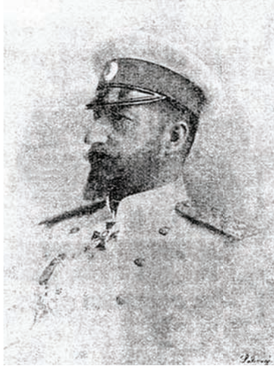
فردينان ملك البلغار.