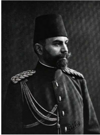
محمود مختار باشا الذي اشتهر بقيادة الفيلق الثالث وجُرح في جتالجه.