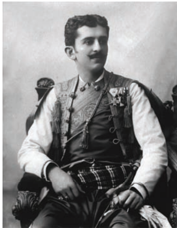
ولي عهد الجبل الأسود الحالي.