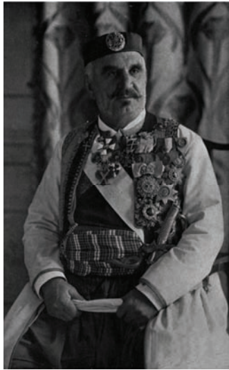
ملك الجبل الأسود.