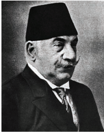
ناظم باشا الذي كان وزيراً للحربية وقتل يوم إسقاط وزارة كامل باشا.