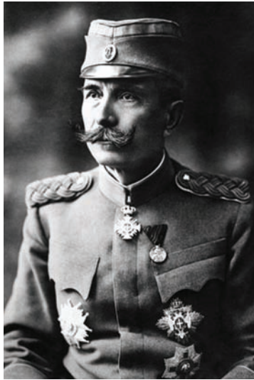
بطرس ملك الصرب.