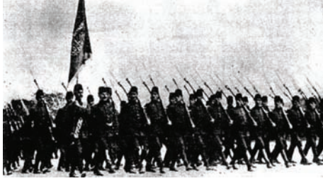
الهلل العثماني في أدرنه.