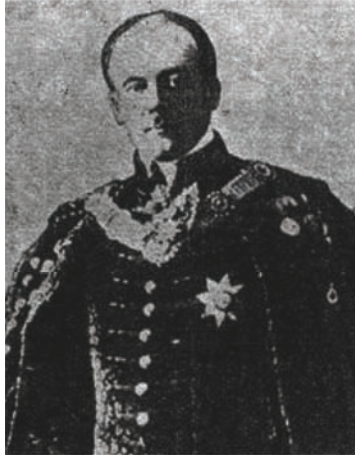
الكونت برشتول وزير خارجية النمسا الذي أصرَّ على طلب استقلال ألبانيا فوافقته الدول.