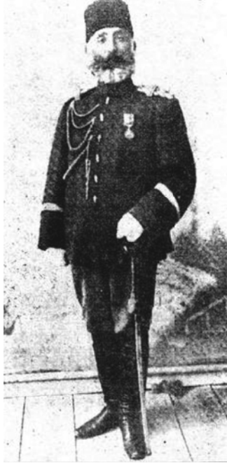
الغازي شكري باشا بطل أدرنه.

فقابل البلغاريون وسائر البلقانيين هذا الاستعداد السلمي بالسرور والارتياح، وعقد قواد البلغار وقواد العثمانيين هدنة شفوية، وسافر مندوبو الحكومات العثمانية والبلغانية إلى لندن للتوقيع على مقدمات الصلح طبقاً لما اقترحتة الدول، وهاك مُجمله؛ أولاً: أن يكون خط التحديد بين تركيا والبلغار ممتداً من إينوس إلى ميديا. كما قدمنا، ثانياً: أن تستقل ألبانيا كما قرر مؤتمر السفراء. ثالثاً: أن يفوض أمر الجزر في بحر إيجه إلى الدول العظمى، وأن تتنازل الدولة عن جميع حقوقها في جزيرة كريت.