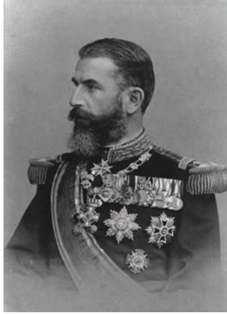
كارل ملك رومانيا التي تهدت بلغاريا بالحرب وأخذت منها سلستريا بدل حيادها.