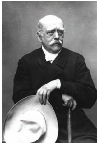
بسمارك رئيس مؤتمر برلين.