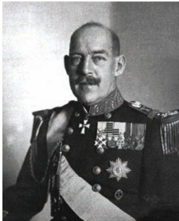
الأمير قسطنطين ولي عهد اليونان الذي صار ملكًا بعد مقتل أبيه.