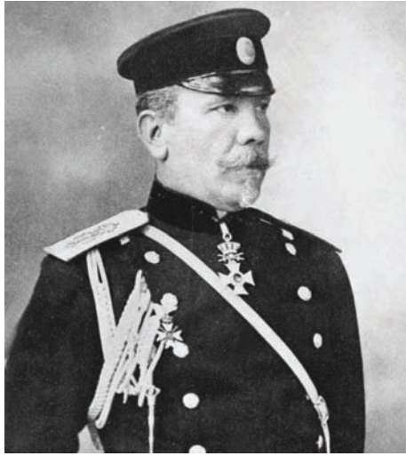
الجنرال سافوف القائد العام لجيش البلغار.