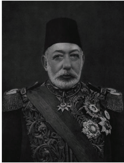
جلالة السلطان محمد الخامس.