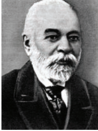
إسماعيل كمال بك رئيس الحكومة الألبانية المؤقتة.