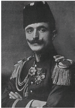
أنور بك الذي قلب وزارة كامل باشا.