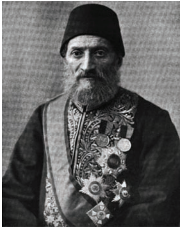
كامل باشا الذي خلف مختار باشا بعد كارثة قرق كليسا.