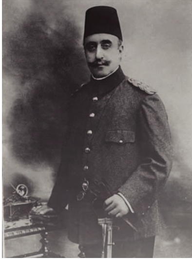
الأمير يوسف عز الدين أفندي ولي عهد السلطنة العثمانية.