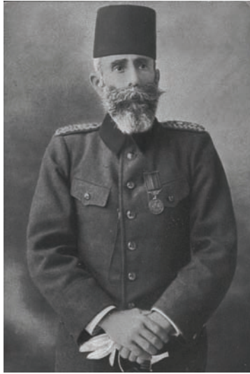
محمود شوكت باشا الاتحادي الذي خلف كامل باشا بعد حادثة الأستانة.