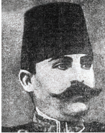
أسعد باشا قائد حامية أشقودره الذي نودي به ملكًا في بعض مدن ألبانيا.