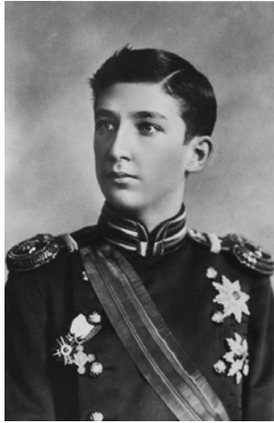
الأمير بوريس ولي عهد البلغار الحالي.