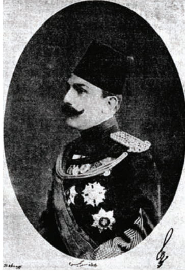
دولة الأمير محمد علي باشا (رئيس جمعية الهلال الأحمر).

وأهم من كل ما تقدم عند أهل الورع منهم ما قاله لنا أحد العلماء المسلمين وهو: «إن المسلم الذي تعلم قواعد دينه يعتقد أن وجود الخلافة واجب كل الوجوب، فلما حدثت معركة لوله بورغاز ثم زحف البلغاريون إلى باب الأستانة اهتز العالم الإسلامي لذاك النبأ الخطير؛ لأن كثيرين من أبنائه خافوا أن توضع مسألة الخلافة المقدسة على بساط البحث عند دخول الأعداء عاصمة السلطنة ومقر الخليفة، ولكن هذا الخوف كان في غير محله.» «أما قولهم: إن أوروبا عرفت بعد حرب البلقان أن الجامعة الإسلامية التي كان يهول بها عبد الحميد لا توجب خوف الدول، فهو قول يسرنا نحن المسلمين الذين ننظر إلى المستقبل؛ لأن أوروبا التي كبرت أوهامها في هذا الموضوع كانت تظهر الخوف من نجاحنا واجتماعنا لإقلاق بالها، أما الآن فقد عرفت أن المسلم مثلاً يميل إلى أبناء دينه ميلاً طبيعياً كغيره، والمأمول بعد زوال هذا الشبح أن تترك أوروبا المسلمين يسرون في سبيل النجاح الطبيعي.»