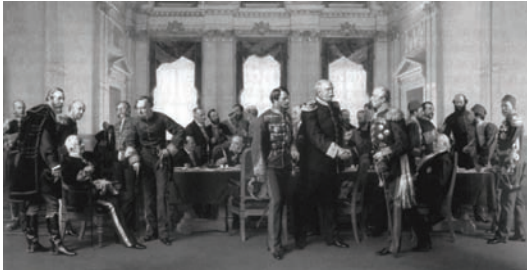
مؤتمر برلين وستري علاقته بالحرب.