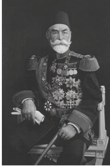
مختار باشا الغازي الذي كان صدرًا أعظم يوم إعلان الحرب.