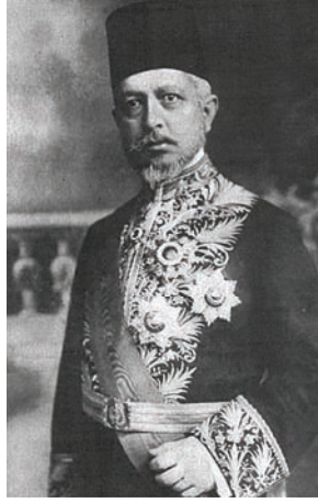
البرنس سعيد حليم باشا الذي عُين وزيرًا للخارجية بعد سقوط وزارة كامل باشا.

الحرب، وكانت الدول العظمى من جهة أخرى تنتظر من وزارة شوكت باشا جوابًا على المذكرة التي بعثت بها في عهد وزارة كامل باشا. وبعد أيام قليلة أرسل الأمير سعيد باشا حليم الذي عُين وزيرًا للخارجية جوابًا إلى الدول قال فيه: «إن الحكومة العثمانية تطلب قسمة أدرنه إلى قسمين: قسم يأخذه البلغار وهو الذي يشتمل على الحصون والمعقل، وقسم يبقى لتركيا وهو المشتمل على المساجد والقبور السلطانية.»