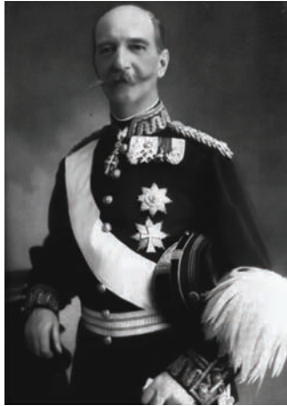
جورج الأول ملك اليونان الذي قُتل في سلانيك.