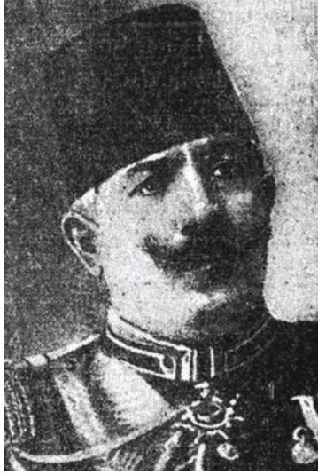
عزت باشا الذي تولى القيادة العامة بعد مقتل ناظم باشا.

وفأوضني في الحالة العامة، وما تمكنت من مغادرة الباب العالي إلا بعد نصف الليل بثلاث ساعات، وكان البرد شديدًا قارسًا، فأثر في صحتي وأصابتني حمى شديدة.