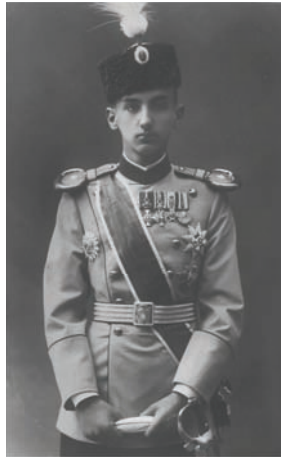
ولي عهد الصرب الحالي.