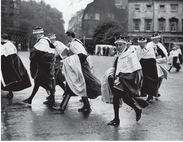
شكل ٥-٦: تتويج الملكة إليزابيث الثانية عام ١٩٥٣م؛ النبلاء المحاصرون يركضون للاحتماء.

الاشتراكية، التي حصلت على السلطة على فترات منتظمة في الغرب، بدت بالكاد أكثر تعاطفًا. وقد فَقَدَ آخِرُ معقل مؤسساتي للسلطة الأرسقراطية — مجلس اللوردات البريطاني — معظم سلطته التشريعية المتبقية فيما يتعلّق بعرقلة القوانين، وذلك على يد حكومة حزب العمال في عام ١٩٤٨م، وَفَقَدَ معظم أعضائه بالوراثة بعد نصف قرن، ويبدو أنه في سبيله إلى فقدان آخِر المنتمين إليه في الوقت الذي يُطبع فيه هذا الكتاب.