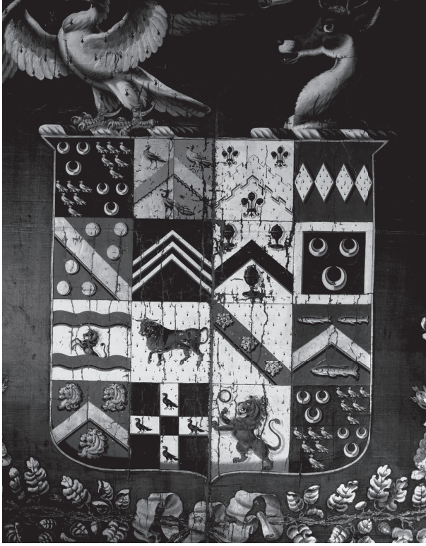
شكل ٢-١: شعار نبالة يحتوي على ١٦ قسمًا: شعار للنسب، تريرس، مقاطعة كورنوال.

الأشياء التي تُحذف أو الإضافات المثيرة للجدل؛ فيشتهر النبلاء باهتمامهم الزائد بما يُشبع غرورهم أكثر من الحقيقة الموثقة أو الدقيقة.