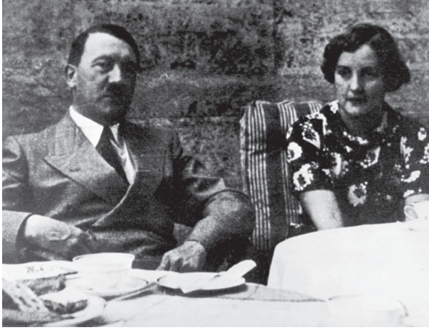
شكل ٥-٥: النبلاء والنازيون: أدولف هتلر مع يونيتي ميتفورد، ابنة اللورد ريديسدال.

الأرستقراطيين الأيرلنديين (حصلوا جميعاً على مكافأة في صورة الألقاب ومقاعد في مجلس اللوردات) كفاً يتسم بالعزم ولا يخلو أحياناً من اليأس من أجل بقاء الوطن. إلا أن النصر في هذه الحرب قد صار فعلياً من نصيب قوى تستنكر الأرستقراطية وكافة أساليبها: الولايات المتحدة والاتحاد السوفييتي. وكانت مكافأة تشرشل على إنقاذه لبلده تصويت رفاقه الديمقراطيين على إقالته من منصبه. وبعد تسع سنوات، قبل تركه لمنصبه للمرة الأخيرة، عرضت عليه الملكة إليزابيث الثانية دوقية. كانت لفتة لا معنى لها — رغم ما بها من إطراء — حيث إنها كانت قد تأكدت مسبقاً من أنه سيرفض. والمفارقة أن أتلي — أحد أفراد العامة والذي حلَّ محله كرئيس للوزراء في عام ١٩٤٥م — قد انتهى الحال بحصوله على لقب إيرل.