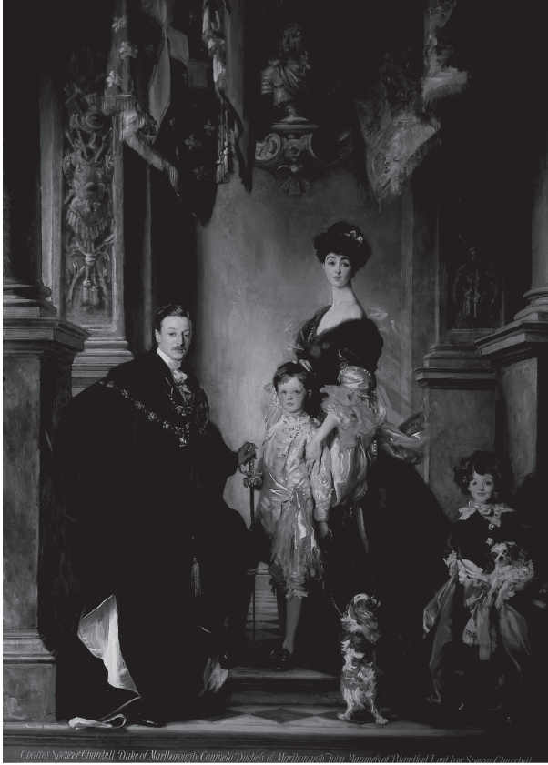
شكل ٥-٤: زواج أحد البريطانيين من أمريكية من عموم الشعب: أسرة دوق مارلبورو التاسع، رسمها جون سينجر سارجنت.

معظم أنحاء أوروبا التحقّت الطبقة المتوسطة المتعلّمة — بأعداد غير مسبوقّة — بطبقة النخبة عن طريق حصولها على مكانة النبلاء، وحتى دون هذا، تسرّبت إلى الرتب العليا للبيروقراطيين والقوات المسلحة على نحوٍ لم يحدث من قبل. وإذا كانت مناصب القيادة العليا لا تزال على نحوٍ مذهلٍ وإلى حدٍّ كبيرٍ في أيدي أصحابها التقليديين، فإن الرتب