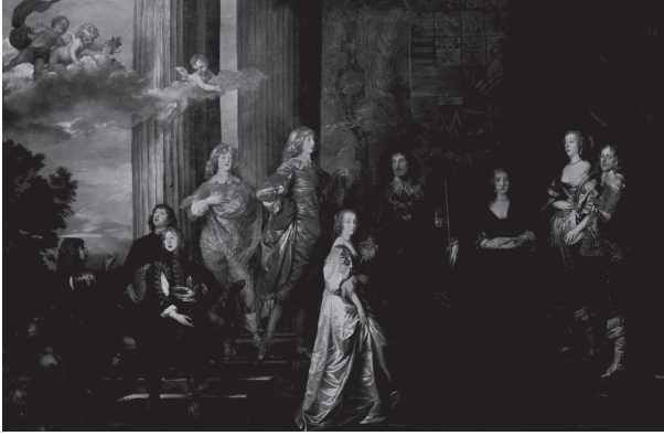
شكل ١-٢: أحد النبلاء الكبار مع عائلته: فيليب هيربرت، إيرل بيمبروك الرابع، رسمها فان ديك، ويلتون هاوس، ويلتشر.

يحيا المنتمي لطبقة النبلاء اعتمادًا على ما يحصل عليه من إيجارات، أو على الأقل ألا يبيع مجهوده أو عمله.» نادرًا ما كانت تُنتهك القوانين التي تُقدّس هذا المبدأ؛ فقد كانت تدعمها تحيّزات قوية ضد الوظائف المهينة استمرت لفترة طويلة بعد انتهاء الحظر الرسمي في أواخر القرن الثامن عشر.