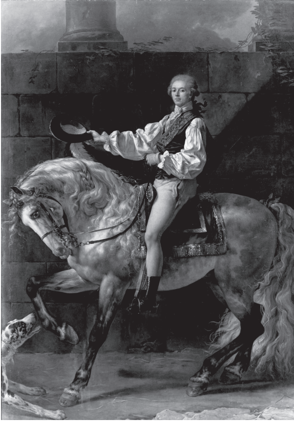
شكل ٣-٣: الكونت ستانيسلاس بوتوتسكي، أحد أصحاب النفوذ البولنديين الكبار. رسمها جاك لوي دافيد، ١٧٨١.

إلى باقي أفراد المجتمع، الذين تأثروا — نظرًا لتقبُّل سيطرتهم في جميع نواحي الحياة — تأثرًا عميقًا بقيمهم ونماذجهم. وإلى حدٍّ ما لا يزال هذا الوضع قائمًا.