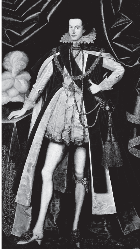
شكل ١-٣: جورج فيليز، دوق باكنجهام (١٥٩٢-١٦٢٨م): أحد المقربين من العائلة المالكة يُظهر أرفع وسام من أوسمة الفروسية.

براغ أو سانت بطرسبرج. وفي لندن، يُعد قصر سبنسر هو الوحيد الذي يستحضر ذكرى المنازل الكبرى التي لم تُعد موجودة في العصر الحالي؛ مثل منازل دوقات ديفونشاير أو نورثمبرلاند. إلا أن القصور الأساسية لهؤلاء النبلاء كانت — وما زالت — موجودة في الريف؛ مثل منازل ألثورب وتشاتسوورث وألنويك في بريطانيا. ظهرت فعلياً لأول مرة المنازل الريفية غير المحصنة البعيدة عن تهديد الحرب في القرن السادس عشر،