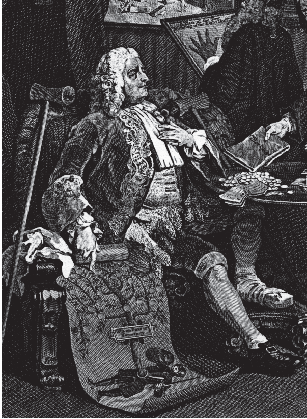
شكل ١-٣: مالكٌ أراضٍ هَرْمٌ يتودّد لعروسٍ شابةٍ باستخدام شجرةٍ عائلته: مشهد من لوحات «زواج عصري» لويليام هوجارت.

مع هذا في الحياة الواقعية كانت الطبقات الأرستقراطية البريطانية دائماً لا تقتصر على النبلاء فحسب؛ فقد كانت رتبة البارونيت — وهي طبقة من الأعيان تتوافر بأعداد أكبر ويتمتع أصحابها بنبالة المولد، ويمكن انتقال ألقابها من جيل إلى جيل بنفس شروط رتبة النبلاء — دوماً المكافئ الواضح لنبلاء القارة الأوروبية الأقل مكانةً. في جولته الكبرى في أوروبا عام ١٧٦٤م، قال جيمس بوزويل الذي اشتهر فيما بعد بأنه كاتب سيرة صمويل