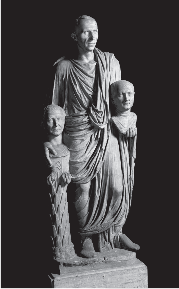
شكل ١-١: أحد النبلاء الرومان مع أسلافه.

بكتير. وقد جعل هذا عائلات أعضاء مجلس الشيوخ أكثر النخب الرومانية حصرياً على الإطلاق. لكن بوجه عام كان الأشراف والفرسان والنبلاء وأعضاء مجلس الشيوخ يرون