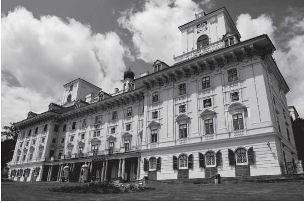
شكل ٣-٢: قصر إسترهازي، في المجر: واحد من المنازل الريفية الكثيرة التي خُصصت لقائد الأوركسترا جوزيف هايدن.

من بعدهم سيخلّدون ذكراهم بنُصب تذكارية مزخرفة ونقوش لفظية تعرض فضائلهم وإنجازاتهم، مما يضيف إسهامهم بعناية إلى سجل التميز العائلي المتنامي.