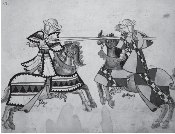
شكل ١-٤: فارسان يتبارزان بالرمح. القرن الخامس عشر.

القاتلة بالرمح لقضاء وقت فراغهم خلال القرن السادس عشر، لكن في القرن السابع عشر عندما كانت مجموعة من الإقطاعيين تُستدعى أحياناً للمشاركة، كانت النتائج تُرى على أنها أكثر من مجرد إحراج لهواة. لكن في هذا الوقت كانت الألقاب المشتقة من أسماء القلاع، والفروسية بوصفها وظيفة محترمة، وحمل شعار النبالة (المستخدم في الأساس من أجل التمييز في المعركة)، والفقهاء المعقّد للإقطاع والصلاحيات المصاحبة له، وقواعد سلوك الفرسان القويم المعروف باسم الفروسية؛ كانت جميعها جزءاً من هوية النبلاء. وجاءت منها جميعاً فكرة أن الرجل النبيل يتوجّب عليه خدمة سيده الأعلى — الملك. وهو شعور بالواجب استمر في شكل التزام واسع النطاق للمهن العسكرية طوال القرن التاسع عشر وبعده.