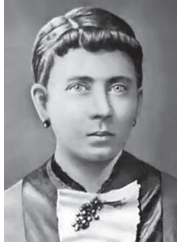
أبو هتلر وأمه.

ولم يكن أبوه متين البنية ولا كان قدوة في الوفاء وضبط النفس وبراعة النشأة، بل كان عرضة لنوبات الفالج تعترية من حين إلى حين، وكان سريع الزواج بعد وفاة زوجاته، وكانت ولادته كما تقدم في غير مهد الزفاف المشروع. فهل ورث هتلر ما يورث من هذين المزاجين؟ لقد كانت أمه تقول له في طفولته إنه صريع القمر Mondsüchtig وهي كلمة تقارب عندنا كلمة «المجذوب» ١ . والذين عاشروه مجمعون على نزقه وسرعة بكائه وكثرة هياجه وتقلب أطواره، ويقول روشننج Rauschnig رئيس مجلس الشيوخ السابق في دانزيغ إنه يتخبط ويتشنج ويستيقظ من نومه وهو صائح مذعور كأنما يهرب من أعداء، والشائع عنه الآن أنه لا ينام ليلة بغير دواء مُرقد إلا إذا كان مبيتته في برختسجادن حيث يهدأ بعض الهدوء ٢ فإذا أضيف إلى الأثر الوراثي في الجسد أنه نشأ وهو يعلم مولد أبيه في غير مهد