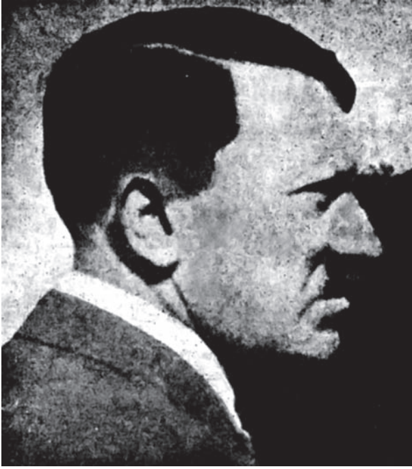
هتلر في نوبة سوداء.