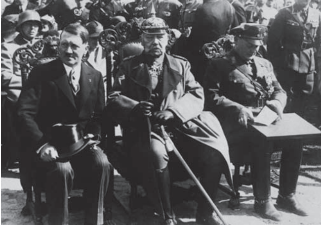
الماريشال هندنبرج بين هتلر وجورنج.

إلا أن الحوادث قد خالفت ما قصد من تدبيره، فجرت الانتخابات الجديدة بإشراف المستشار هتلر على الطريقة النازية المعهودة، وصدرت المراسيم بحل جماعات الشيوعيين، واشتد المرض بالماريشال الهرم فأصبح لا يعي ما يقول ولا ما يقال بلسانه، ثم مات وتبوأ هتلر مكانه باسم زعيم الأمة ومستشار الدولة، وأفلتت الأعنة من يدي فون باين فانقاد لسائقه.