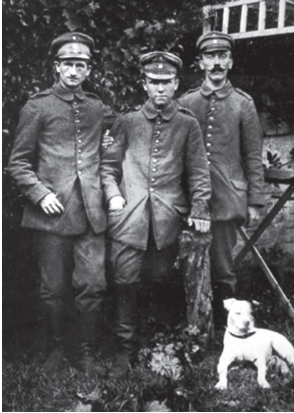
هتلر مع زميلين.

وقد وقع الاختيار على هتلر للمراسلة في مكتب الفرقة المتطوعة فلم يكن من الذين يحضرون حرب الخنادق في جميع الملاحم. وثبت أن الإصابة التي انتقل من جِرائها إلى المستشفى قبيل انتهاء الحرب كانت أهون كثيراً من الأخطار التي تعرض لها غيره؛ لأنها كانت إصابة بالغازات المُدَمعة Lachrymatory gas. التي لا تستلزم الالتحام في الهجوم، ولو أنه أصيب بأقوى من هذه الغازات لما سلم نظره ولا زالت آثاره كل الزوال كما ثبت من امتحان عينيه.