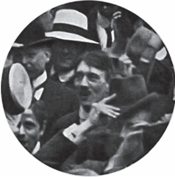
هتلر يسمع إعلان الحرب الماضية سنة (١٩١٤).

فإنكار الجريمة لا ينفى طبيعة الإجرام. وكفى أن يكون الشر سهلاً يواقعه المرء لأيسر ضرورة أو لضرورة موهومة لتثبت طبيعة الإجرام أيما ثبوت. وما ضرورة دانزيج، وما ضرورة تأجيلها أو انتظار اليأس من المفاوضات فيها؟ ليست بضرورة على الإطلاق. لكنها مع هذا كانت أعضل على هتلر من معضلة المغامرة بسلام الدنيا ومصير بني الإنسان.