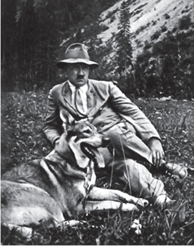
هتلر مع كلبه.

بمجهود عظيم. فلماذا غابت أدلة البر كلها ولم يبقَ لها من دليل في نفس هتلر إلا البر بذكرى أمه؟ وإلا ما يقال من مودته للطفل والكلب والعصفور وهي الخلائق التي يشتري مودتها ولا تكلفه من جانبه مودة إنسانية كبيرة؟ سبب واحد يفسر ذلك أوضح تفسير وأصدق تفسير، وهو أن المودة الإنسانية في نفسه ضعيفة، وأنه لم يكسب إلا مودة