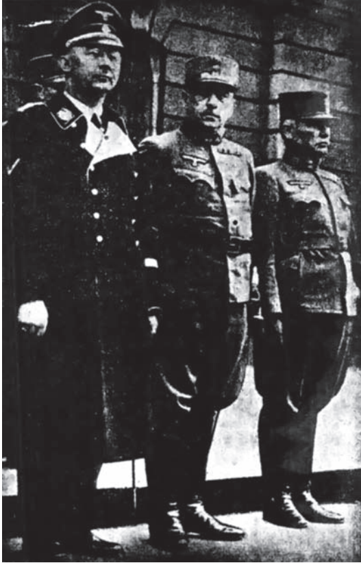
هيملر عين هتلر التي لا تغمض وإلى جانبه ضابطان نمسويان.

للأخبار واختراعًا للجنايات والأكاذيب، وقيامًا «بوظيفة نازية» لا يخطر على البال أن يضطلع بها رجل صادق شريف.