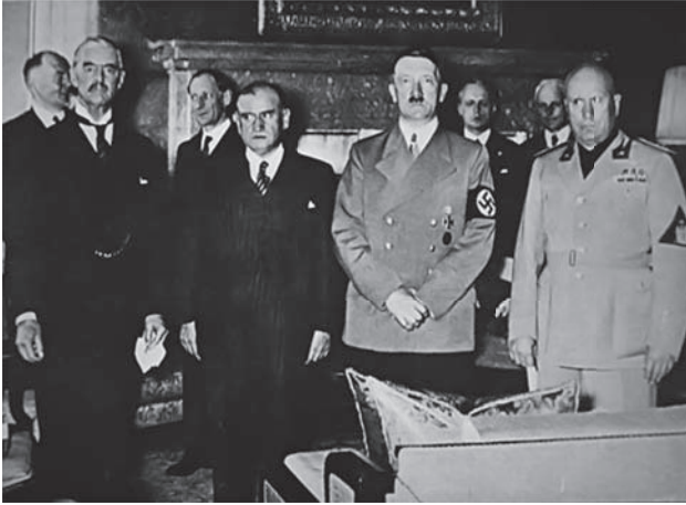
هتلر مع شامبرلين ودلاييه وموسوليني.

قال لهم البسوا الكساوى والشارات التي تحبونها، واخرجوا في الشوارع صفوفًا صفوفًا تزعمون وتتوعدون، واضربوا اليهود واضربوا الشيوعيين واضربوا الديمقراطيين واضربوا النازيين المخالفين ... اضربوا اضربوا ولكم المجد والفخار وعلى فرائسكم المسبة والعار.