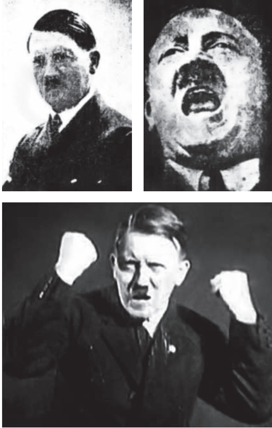
هتلر بين الوجوم والغضب الخطابي.

فالرجل المفطور على عاطفة يساجل بها العواطف، وفكرة يقابل بها الأفكار، يقول ويسمع، ويستميل الفرد بالوسائل التي يستمال بها الأفراد، مرةً بالإيحاء ومرةً بالدليل ومرةً بالشرح المفهوم، وفي كل مرة بتبادل الثقة والاعتراف بحق المناقشة والاعتراض. أما الرجل الذي نضبت نفسه من جانب العاطفة الفردية، والذي ليس عنده ما يتبادل به مودة بمودة أو فهمًا بفهم أو خاطرًا بخاطر، والذي انقطعت جميع الوشائج