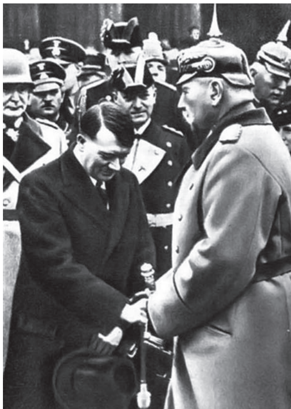
هتلر بين يدي هندنبرج.