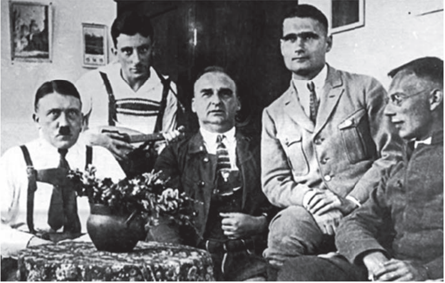
هتلر وزملاؤه في السجن (تلاحظ هدية الزهر التي كانت أمامه).

ولما تبين أن «الجنسية الألمانية» لا تشملها لأنه رعية الحكومة النمساوية، احتالت وزارة برنسويك على الأمر بتعيينه في وظيفة «شرفية» تسمى وظيفة الاستشارة في تلك الحكومة Regierungsrat ليصبح ألماني الجنس بحكم التوظيف؛ وفقاً لدستور فيمار الذي يشمل الجنسية الألمانية كل أجنبي يشغل وظيفة في حكومات الولايات، أو حكومة الريخ الكبرى.