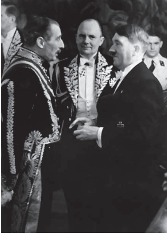
هتلر مع السفير البريطاني.

وقد جمعنا في هذه الصفحات صورًا عدة لهتلر وهو يخاطب، أو وهو يغضب؛ لأنه في الحقيقة قَلَّمَا يخاطب إلا ليغضب. فأية صورة من تلك الصور يا ترى يستطيع القارئ أن يكتب تحتها مثلًا: «هذه صورة هتلر يزأر أو يزمجر؟» إن هذا الكلام لِيُكْتَب تحت صور كثيرة لمصطفى كمال أو لسعد زغلول، ولكن هتلر — على عنايته بصوره واتخاذهِ رسامًا خاصًا يتبعه في جميع المحافل ويوزع في أقطار العالم ألوف الصور بل عشرات الألوف منها — لا توجد له صورة واحدة تُخَيَّل