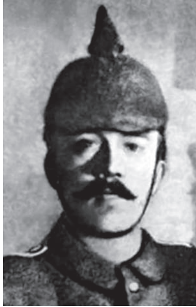
هتلر كما كان في الحرب الماضية.