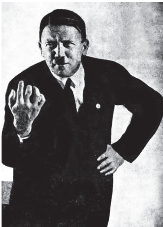
هتلر یوضح نفسه.