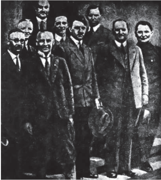
هتلر وأصحابه قبل زهو النجاح.