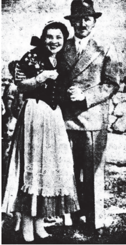
موقف هتلر مع فتاة.

وبعد أشهر قليلة قتل هتلر هذا الصديق والزميل ومئات من رجاله شر قتلة، ووصمه بكل رذيلة من الرذائل التي كان يعلمها ويعتذر عنها بين أصحابه، ولا تمنعه أن يفخر بالصدقة والزمالة للعزيز إرنست روهم. ولم يتقدم هتلر بوثيقة واحدة تُسوِّغ تلك المجزرة الجائحة فيما بين يوم وليلة، مع استيلائه على أزمّة البحث والتحقيق في البلاد الألمانية بأسرها.