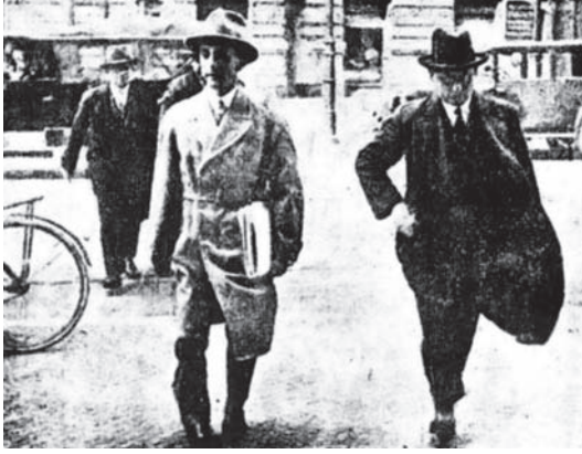
جوبلز «الآري» يحرسه رجال الشحنة.

معروضاً به: «نحن الألمان نحب صيغة الجمع لغير داعٍ». فنقول مثلاً: إن الأكاذيب قصيرة الأرجل ... لماذا لا نختصر فنقول: إن الأكاذيب لها رجل قصيرة!