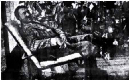
هتلر في حياته الهادئة.