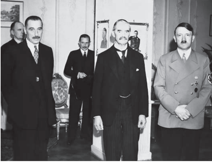
هتلر مع شامبرلن وهندرسون السفير البريطاني.

كبحوا حريتهم العالية على الأحرار ثم أشبعوا نفوسهم المكبوحة بشهوة العدوان على حرية الناس. فكانوا خاسرين في الصفقتين، غادرين بحرمااتهم وحرمات من يعتدون عليهم. وبئس التعليم إن كان هذا الصنيع في حاجة إلى تعليم. إنما المعجزة أن تعلّم المرء الكرامة فلا يهدر حقوقه ولا يهدر حقوق غيره، وإنما الرجل الكريم كما قلنا في كتابنا عن سعد زغلول من «يسوءه أن يتعرض الآخرون لغضاضة مهينة كما يسوءه أن يتعرض هو لتلك الغضاضة، ويعاف الذل حيث كان ولو لم يمسه في كبريائه، وذلك هو الفرق بين الكرامة المحمودة والغطرسة الذميمة؛ فإن الغطرسة الذميمة هي التي تستريح إلى إذلال الآخرين ولا تغار على كرامة إنسان، وهي التي لا تميز بين الكبرياء بحق والكبرياء بباطل، ولا تلوم الناس لأنهم اعتدوا عليها مبطلين بل تلومهم لأنهم عرفوا لأنفسهم كرامة ولو كانت صادقة وعلى صواب؛ ولهذا يستخذي المتغطرس حين تصدمه القوة من سواه، ولا يزداد الكريم إلا انتصارًا لكرامته حين يمسه من يتناول عليه».