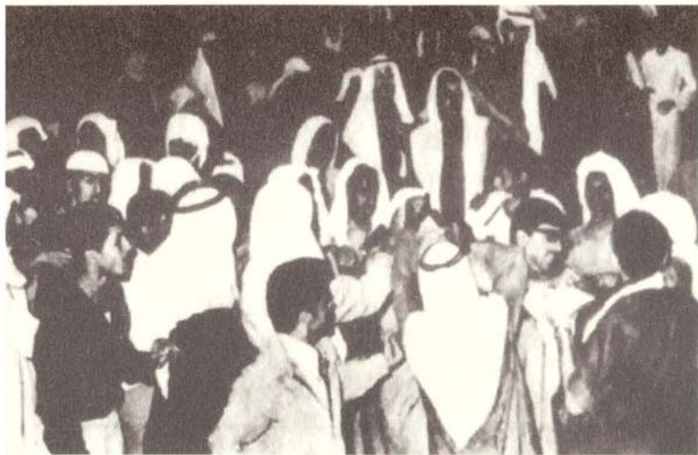
عراك بين أنصار الاختلاط والمعادين له .