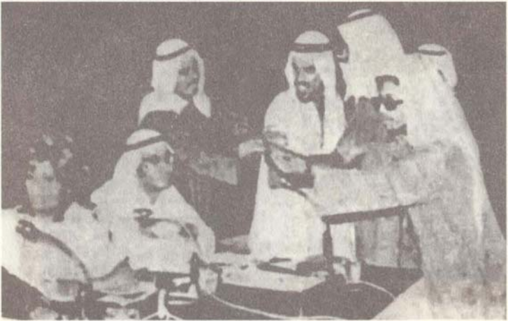
بعض حضور ندوة الدعوة للاختلاط