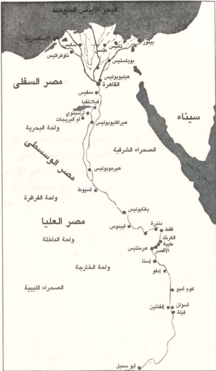
مصر في عهد كليوباترا