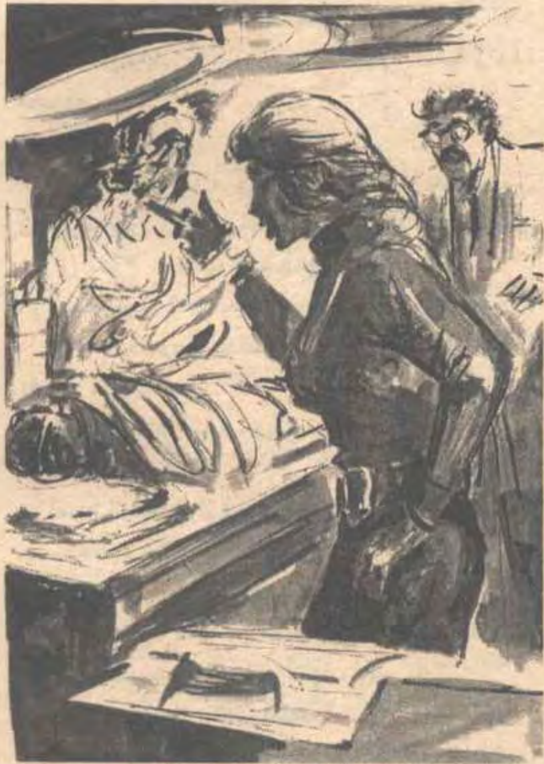
ثم نفثت الدخان نحو (منى) مباشرة ، قبل أن تضيف في صرامة : ولكن هذا لا يعنيني قط ..