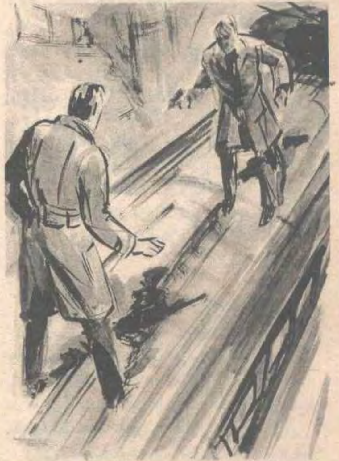
ورأى (أدهم) سقف النفق في مستوى أقل من ارتفاع رأس (هايدن) ، والذي لم ينتبه إلى هذا ..

وعلى الرغم من هذا ، لم يحاول ( أدهم ) المقاومة .. لقد ترك رجال المباحث الفيدرالية يحيطون به ، ويضعون أغلالهم في معصميه ، ويقودونه إلى سيارتهم ، وكانما فقد مع مصرع ( هايدن ) ، رغبته في الفرار أو النجاة ..