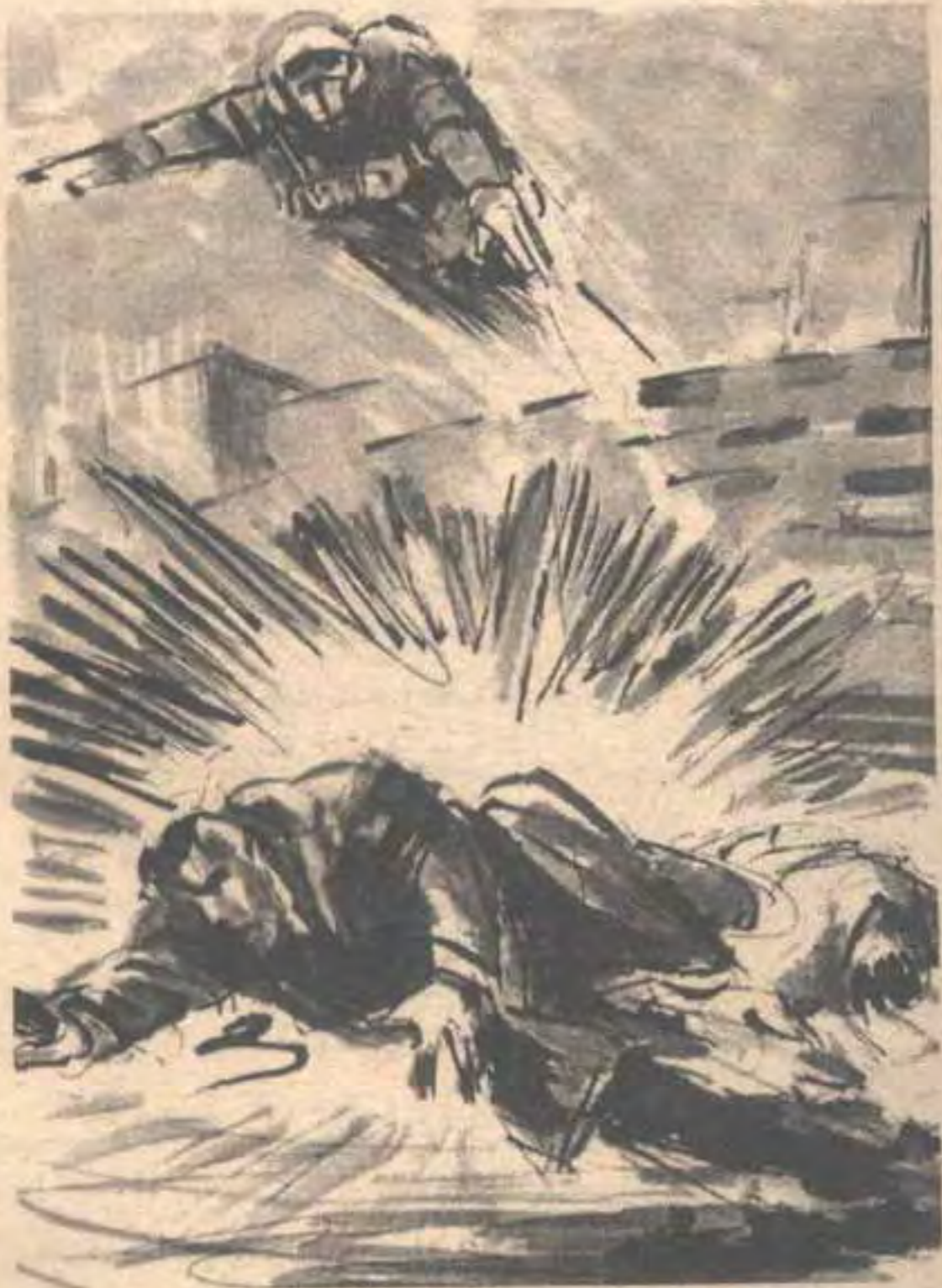
ومع الانفجار العنيف ، طار جسد (أدهم) في الهواء لخمسة أمتار كاملة ، في اتجاه مضاد لجثة (ويلي) ..

صرخ (جاك) في غضب : - فليكن .. أنتم أردتم هذا . وبكل غضبه ، أطلق نحوهم رصاصات قفازه ، متجاهلاً حقيقة كونه أحد رجال المخابرات ، وليس أحد رجال العصابات ..