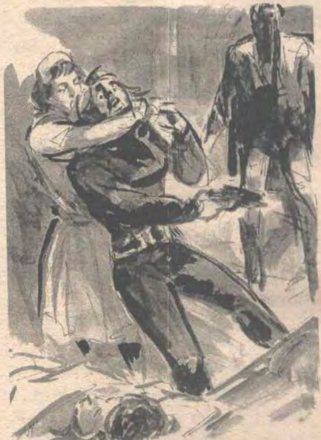
ومع صرخته ، انطلقت صرخة أخرى .. صرخة الممرضة ، التي ولبت تتعلق بعنق الشقراء ..

وكانما حمل هتافه هذا الكلمة السحرية المنشودة ، فقد توقفت الممرضة عن تحطيم ما تبقى من الجمجمة