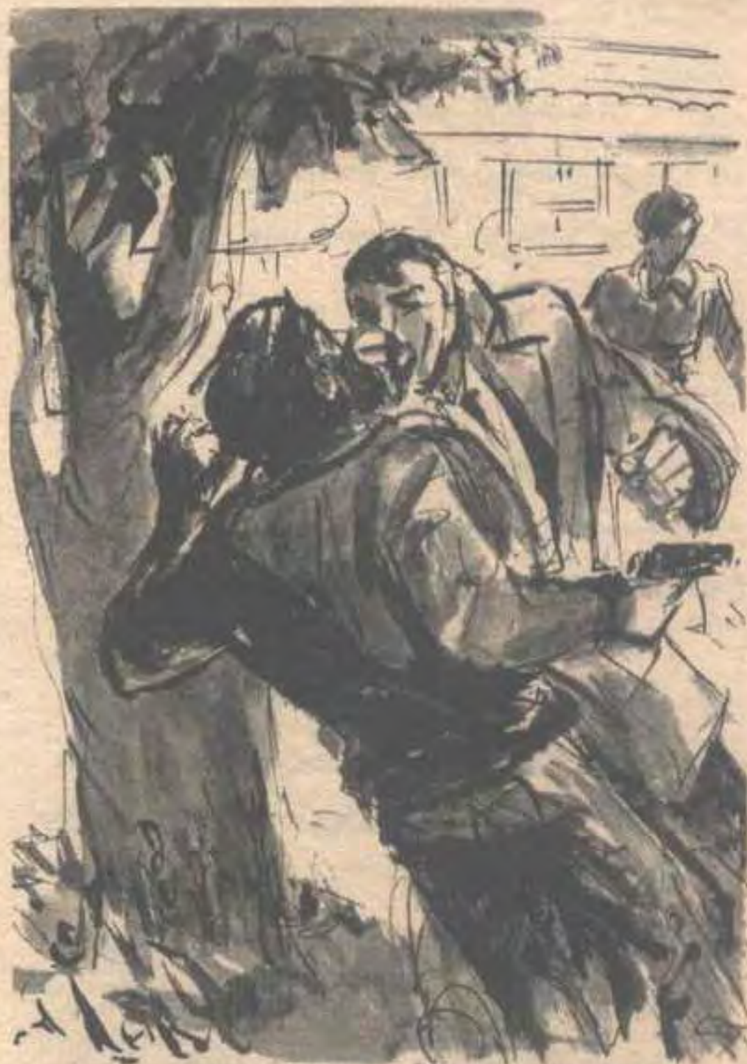
كادت قبضة (أدهم) تحطم فك الرجل وأنفه بلكمتين ساحقتين سريعتين ، وتسقطه فاقد الوعي ..

- قل لى يا سنيور ( أميجو ) : كيف عثرت علينا ؟! أشار ( أدهم ) إلى الرجال الفاقدين للوعي ، الذين انهمكت ( جيهان ) فى تقييدهم فى ضجر ، وهو يقول :