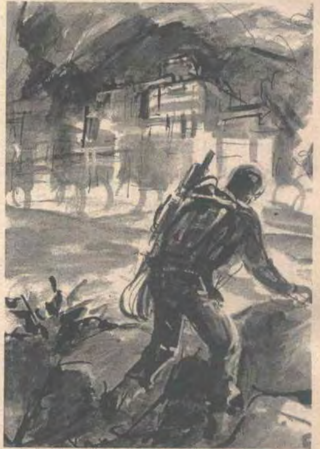
ثم وثب من التبة الصخرية ، وتحرك بسرعة نحو النقطة التي اختارها ..

وفجأة ، التصقت فوهة مدفع آلي باردة بصدغه ، وسمع صوتاً خشناً فظاً ، يقول : - انتهت الرحلة هنا يا رجل .