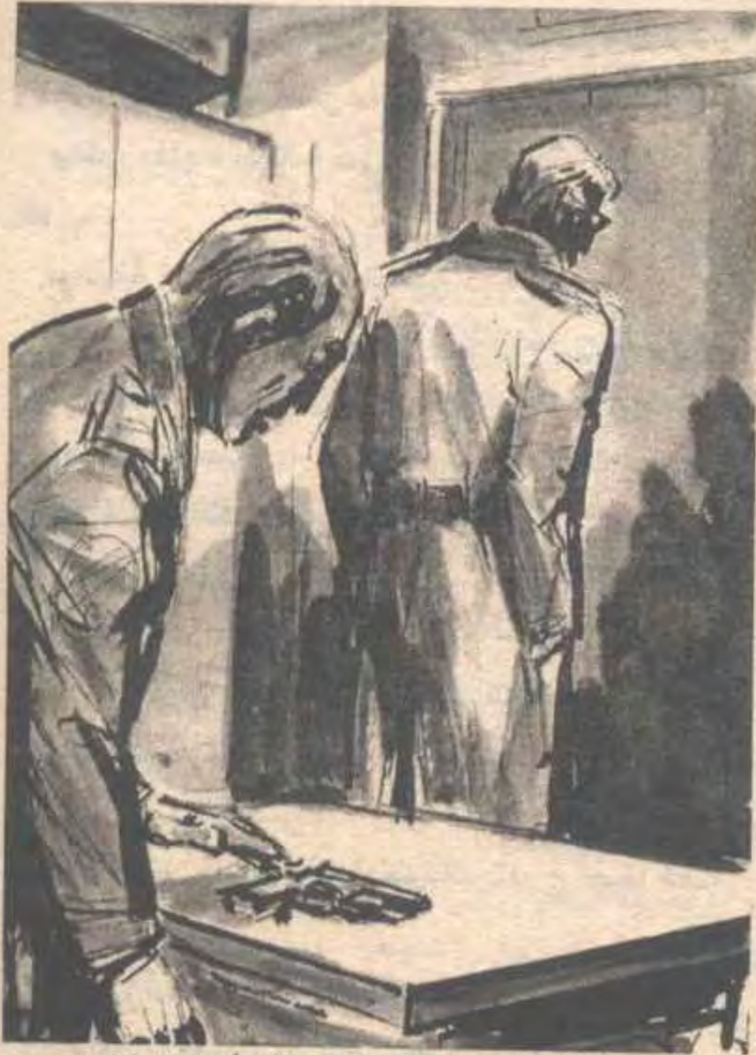
تطلع (تورنسول) مرة أخرى إلى المسدس ، وامتدّت أصابعه المرتجفة إليه ..

- والقرار لك وحدك يا جنرال . تطلع (تورنسول) مرة أخرى إلى المسدس ، وامتدّت أصابعه المرتجفة إليه ، و ... وبرقت عينا مندوب وزارة الدفاع في ظفر ، عندما دوت الرصاصة في قلب الاستاد ، لتضع نهاية لفصل آخر من فصول اللعبة .. لعبة الخطر .. والموت ..