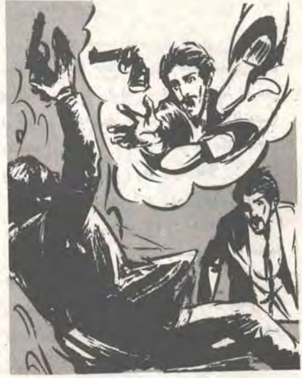
ثم ففز إلى أعلى ، والظن المسدس في الهواء ..

صمت (أمين) فترة طويلة ليفكر ، ثم قال : — حسنا يا مسيو (أدهم) ، إن التفسير لا يعني كثيرا ، ما دمت سأحفظ بنسخة واضحة من المعلومات .