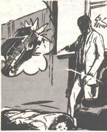
يجب ( أدهم ) مسدسه ، وقفز نحو النافذة ، ولكنه رأى سيارة زرقاء تتطلق بسرعة ..

— إنها فرصة ضييلة ولكنها قد تؤدي إلى النجاح ، لو أمكننا تنفيذها قبل أن يصل خير مصرع ( أيمن بن علي ) إلى صحف ( مونت كارلو ) الصباحية .