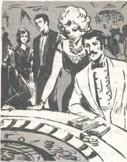
كان رجلاً طويل القامة ، أسود الشعر ، وسم الملاح ..

اختلست ( هويدا ) النظر إلى الرجل الذى تحدث