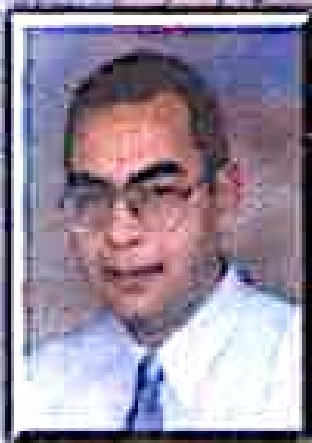
د. احمد خالد توفيق

إنه يوم لم تشرق له شمس .. يوم عرفنا بدايته لكننا نجهل كل شيء عن نهايته .. اليوم تبسط الوحوش سلطانها، ويبدأ حظر تجوال من نوع خاص ... اليوم تزان السباع وتخور الثيران وتخلق النسور وتحوم الطاويط .. فالיום هو يوم تارت الوحوش ..