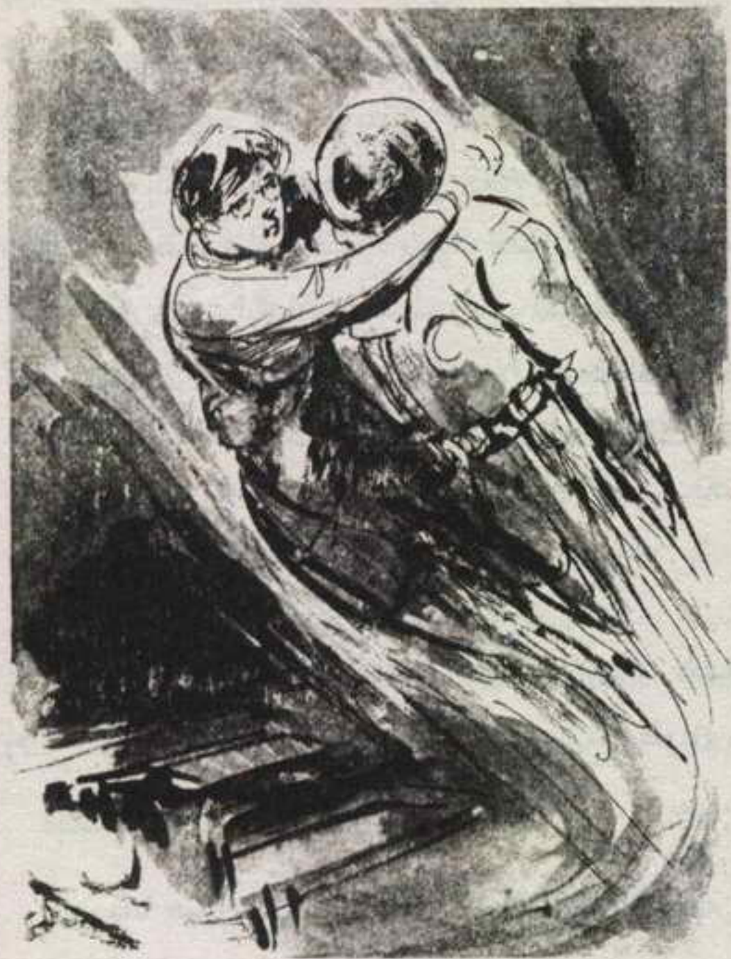
ألقي (سيف) السؤال في اللحظة نفسها ، على مسامع الدكتورة (فاتن) ، وهو يطير بها مبتعداً ..