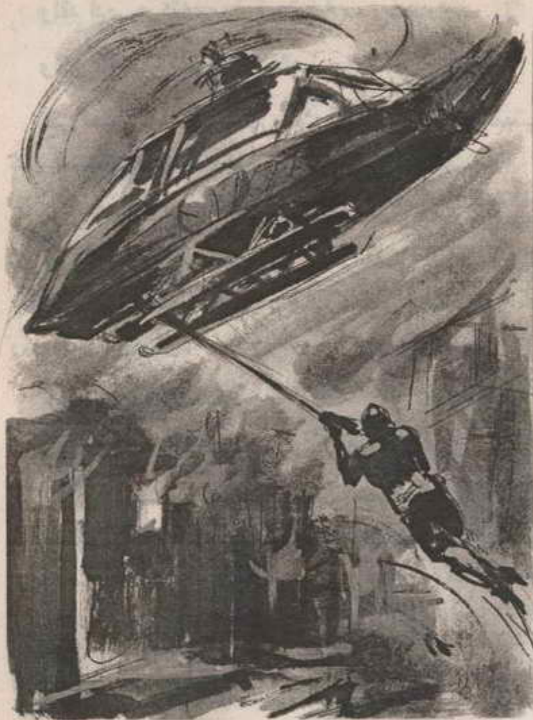
تعلق الحبل بطرف القائم السفلى الأيسر للهليكوبتر ، ووثب ذلك الشخص يتعلق به ويتسلقه ..

وفي لحظة واحدة ، تعلق الحبل بطرف القائم السفلى الأيسر للهليكوبتر ، ووثب ذلك الشخص يتعلق به ، ويتسلقه بسرعة مخيفة ..