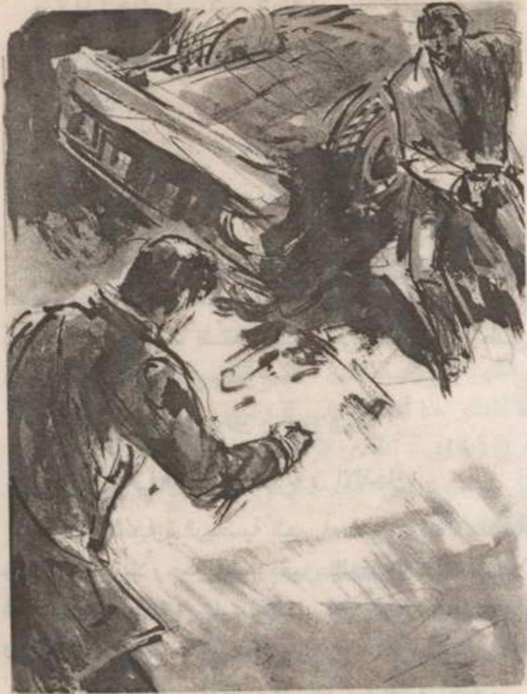
وفي نفس اللحظة التي بدأ انطلاقه فيها ، كان القاتل يشب خارج السيارة ، وهو يحمل مسدسه ..

كان من الواضح أن اغتيال والده ، على يد قتلته من الصهاينة ، قد ترك في نفسه بغضاً شديداً لكل عمليات القتل والاغتيال ، وغضباً بلا حدود على كل قاتل ..